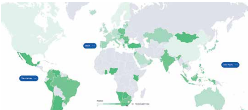
Рис. 1. Рейтинг цифрової конкурентоспроможності IMD World Digital Competitiveness Ranking станом на 2025 рік