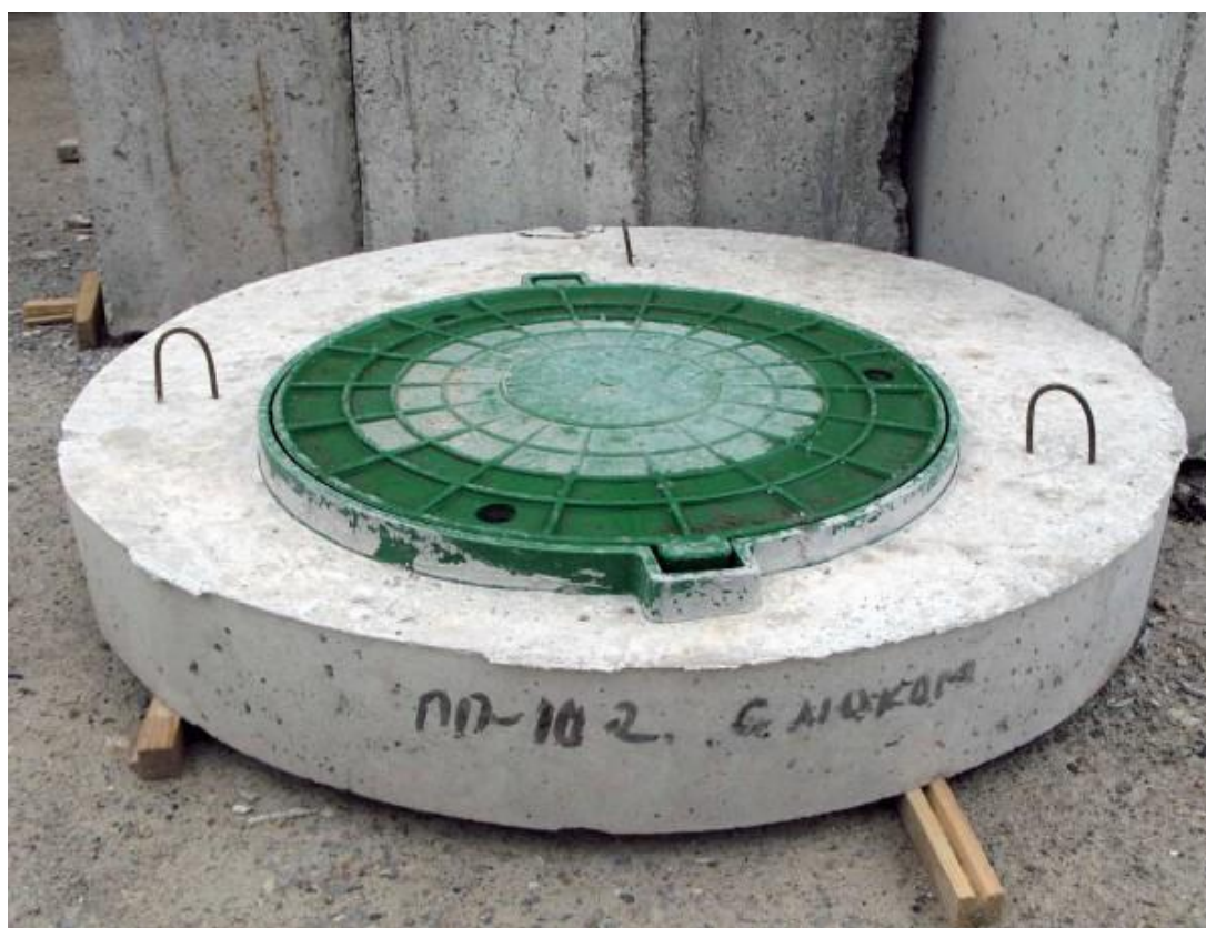
Рисунок 3 – Плита ПП 10-2 з люком

Слід зазначити, що вага виробу не повинна перевищувати вантажопідйомність обладнання для дотримання встановлених виробничих технологічних параметрів.