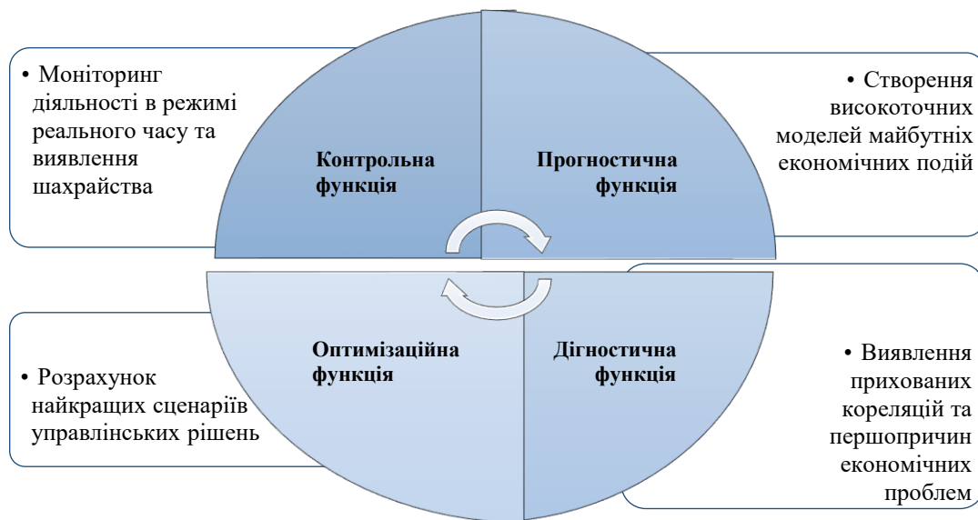
Рис. 3. Функції Big Data у процесі отримання результатів сформовано авторами з [13]

функцій, які Big Data виконує в наукових дослідженнях. Візуалізація цих функцій дозволяє краще зрозуміти їхню інтегративну роль у процесі отримання результатів (рис. 3).