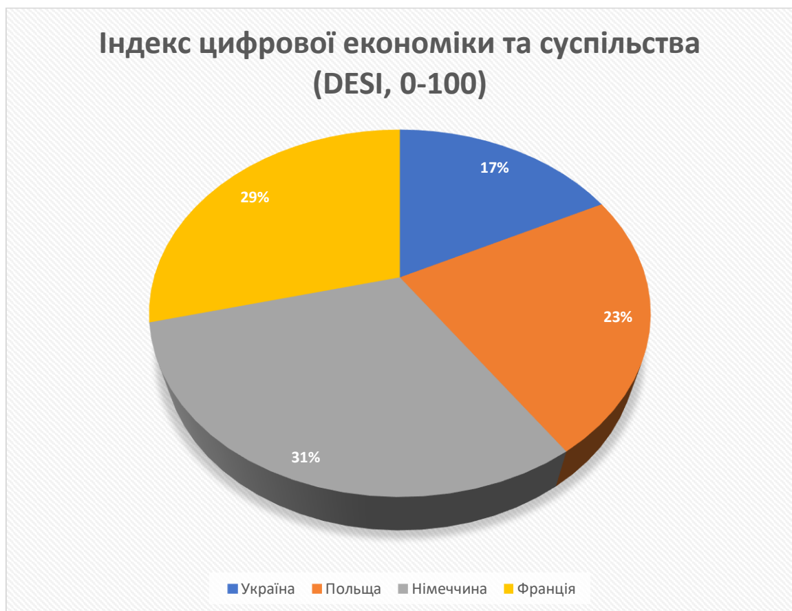
Рисунок 1 - Індекс цифрової економіки та суспільства

Німеччина – демонструє найвищі показники за всіма критеріями. Беззаперечний лідер у диджиталізації, особливо у сфері електронного урядування, кібербезпеки. Франція – поступається Німеччині, але має сильні позиції в e-commerce та цифровій інфраструктурі. Польща – демонструє швидке зростання, особливо у сфері IT-стартапів і хмарних технологій. Україна – відстає через війну, але має високий потенціал у розвитку IT-сектору, кібербезпеки та найвищий ріст інвестицій у диджиталізації (+24% з 2023 року) (рис. 1).