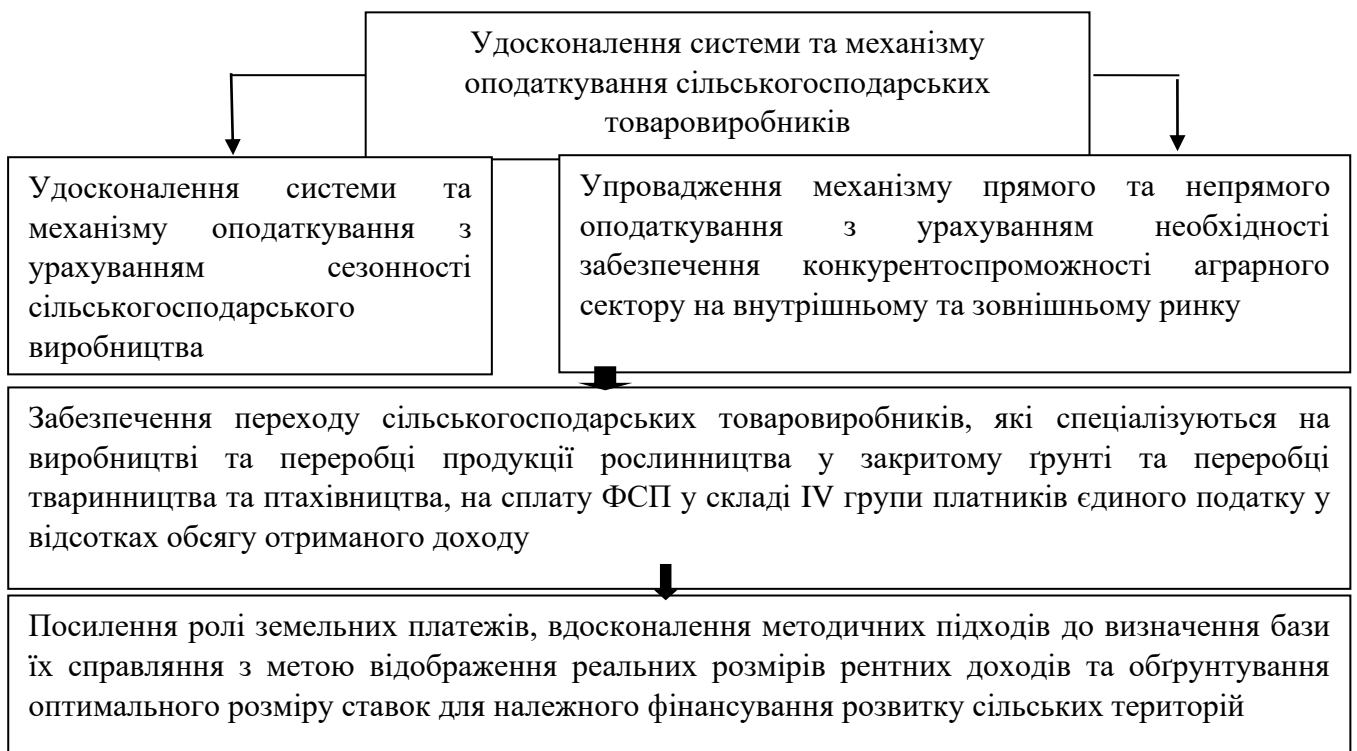
Рис.3 Удосконалення системи та механізму оподаткування для сільськогосподарських товаровиробників

Спираючись на проведені спостереження, можна твердити про значну кількість проблемних моментів у функціонуванні механізму оподаткування сільськогосподарських підприємств. При цьому основна їх причина полягає в неузгодженості правових норм розуміння суб'єкта оподаткування, що викликає непорозумілість і доцільність застосування щодо них відповідного режиму оподаткування. Нез'ясованою залишається і необхідність та взагалі доцільність застосування спеціального режиму щодо оподаткування доданої вартості у деяких сільськогосподарських підприємствах. Пропонуємо розглянути систему удосконалення оподаткування сільськогосподарських підприємств (рис.3).