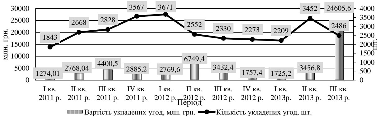
Рис. 2. Динаміка кількості і вартості укладених договорів фінансового лізингу поквартально протягом 2011 – 2013 років в Україні