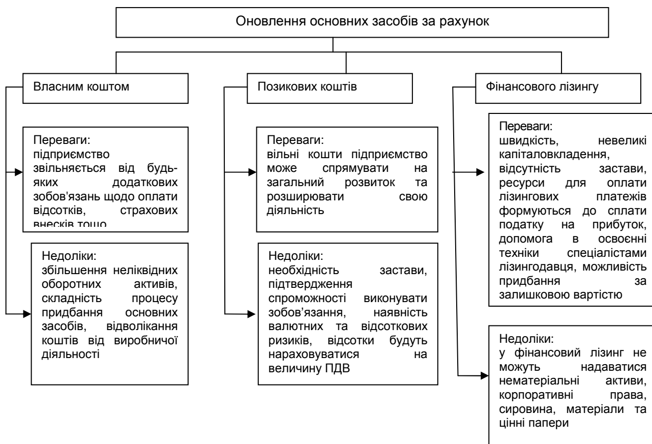
Рис. 1. Шляхи оновлення основних засобів підприємства

Проведене оцінювання стану та придатності основних засобів в Україні виявило, що 76,7% споруд, техніки й обладнання українських підприємств є зношеними фізично і морально застарілими [4]. Це зумовило необхідність визначення шляхів фінансування оновлення основних засобів, що зводяться до трьох основних варіантів: власним коштом, за рахунок позикових коштів та шляхом фінансового лізингу (рис. 1).