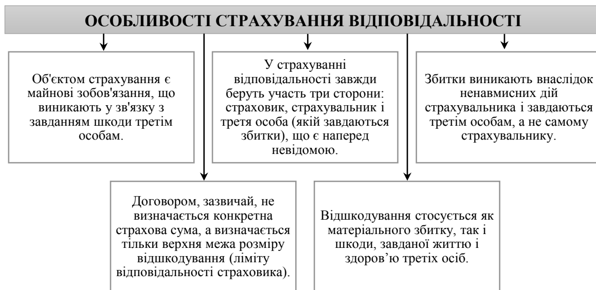
Рис. 1. Особливості страховання відповідальності як окремої галузі страховання

Страховання відповідальності – це форма страховання, яка захищає страхувальника від фінансових наслідків відшкодування шкоди, яку він може завдати іншим людям або майну [2]. Основна ідея полягає в тому, що страхувальник укладає угоду зі страховиком, яка передбачає виплату відшкодування в разі, якщо страхувальник буде відповідальним за певні види збитків. Специфіка страховання відповідальності виявляється у його характерних рисах, наведених на рис. 1.