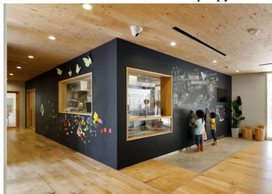
Дитячий сад Nursery Hibinosekkei, Японія

суцільні поверхні як активні елементи інтер'єру