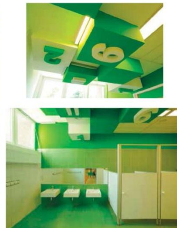
Реконструкція дитячого саду у м. Тихи, Польща (Роберт RS+Stitek)