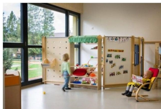
Дитячий сад у Словенії, Архітектура Jure Kotnik