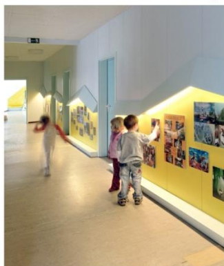
Дитячий сад в Така-Тука-Ланд у Берліні (Германія)