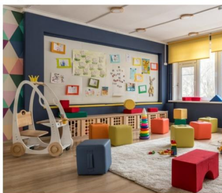
Реконструкція типового дитячого саду № 1571 у м. Москві, Росія