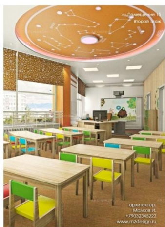
Дизайн дитячого саду, арх. І. Малков, Росія

інтегровані у поверхні (стелі, стіни, підлоги)