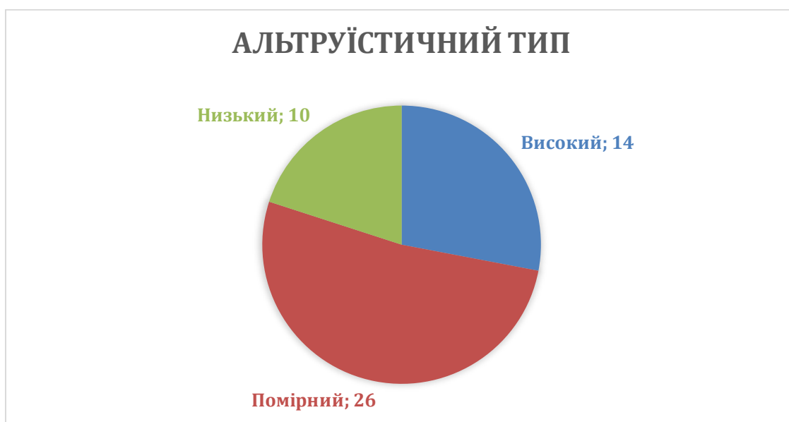
Рисунок 3.6. Результати альтруїстичного типу поведінки досліджуваних

Аналогічний вектор розвитку підтверджується аналізом альтруїстичного типу поведінки, де високий рівень прояву було зафіксовано у 28% респондентів (14 осіб), середній рівень охопив найбільшу групу – 52% (26 осіб), а низький рівень виявився характерним для 20% військовослужбовців, що відповідає 10 особам.