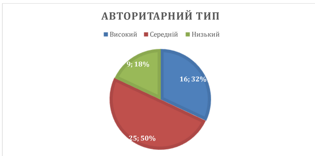
Рисунок 3.4. Розподіл відповідей щодо авторитарного типу поведінки

Отримані співвідношення наочно свідчать про виражене прагнення майже третини піддослідних до жорсткого домінування у процесі комунікації, встановлення тотального контролю над діями інших людей та абсолютну впевненість у правоті власної позиції. Варто підкреслити, що у специфічному військовому середовищі певний рівень авторитарності є професійно обумовленим та навіть необхідним конструктом, оскільки службова діяльність безпосередньо базується на суворій дисципліні, чіткій вертикалі підпорядкування та потребі миттєвого прийняття одноосібних рішень у критичних ситуаціях. Проте надмірний рівень авторитарного стилю поведінки поза межами виконання статутних завдань суттєво ускладнює повсякденне міжособистісне спілкування, блокує зворотний зв'язок і виступає потужним тригером для розгортання затяжних внутрішньогрупових конфліктів у підрозділі, що підтверджується даними.