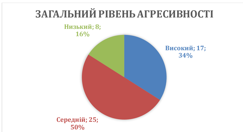
Рисунок 3.3. Результати методики «Опитувальник агресивності Басса-Даркі»

Низький рівень загальної агресивності було діагностовано лише у 16% військовослужбовців, що відповідає 8 особам із загального числа піддослідних (рис. 3.3.). Слід зазначити, що такі мінімальні показники у військовому середовищі можуть інтерпретуватися двояко. З одного боку, вони вказують на високу емоційну стійкість, сформованість навичок саморегуляції, миролюбність та виражену прагнення до компромісного вирішення конфліктів. З іншого боку, в умовах жорстко регламентованої військової служби та бойового стресу надмірно низька агресивність іноді може виступати проявом пасивності, емоційного гальмування, захисного витіснення реальних емоцій або ж свідчити про формування деструктивних тенденцій у вигляді аутоагресії, коли незадоволеність та напруга спрямовуються особистістю на саму себе через неможливість зовнішнього прояву.