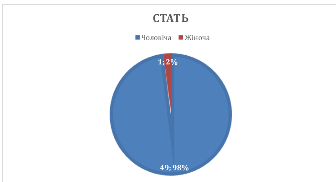
Рисунок 3.1. Розподіл вибірки за статтю

Емпіричну базу дослідження склали 50 діючих військовослужбовців, які брали участь у тестуванні на добровільних засадах та були заздалегідь проінформовані про повну анонімність і конфіденційність отриманих результатів. Аналіз статевої структури сформованої вибірки показав, що більша частина респондентів, а саме 98% від загальної кількості, що відповідає 49 особам, представлена чоловічою статтю, тоді як жіноча стать складає 2%, що становить 1 особу (рис. 3.1.). Усі залучені до дослідження особи проходять військову службу та мають безпосередній досвід професійної діяльності в умовах підвищеного психоемоційного та фізичного навантаження.