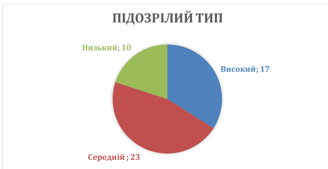
Рисунок 3.5. Відповіді військовослужбовців «Підозрілий тип поведінки»

При вивченні результатів за шкалою підозрілого типу поведінки було виявлено, що високий рівень за даним фактором демонструють 34% респондентів (17 осіб), середній рівень зафіксовано у 46% (23 особи), тоді як низький притаманний 20% військовослужбовців, що становить 10 осіб від загальної кількості (рис. 3.5.).