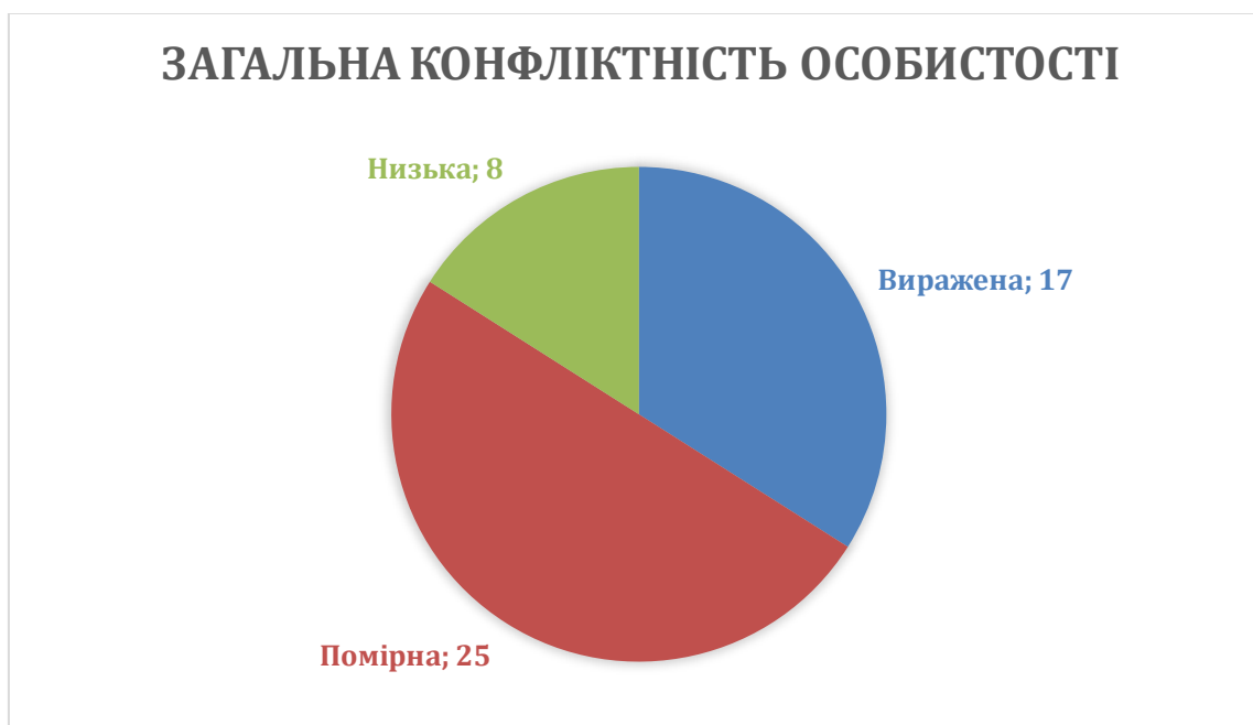
Рисунок 3.7. Розподіл військовослужбовців за рівнем загальної конфліктності за методикою Є.П. Ільїна, П.А. Ковальова

Первинний аналіз відповідей дозволив здійснити розподіл досліджуваних військовослужбовців за трьома базовими рівнями вираженості конфліктності, що показує загальну картину емоційного стану та комунікативних тенденцій всередині досліджуваного підрозділу.