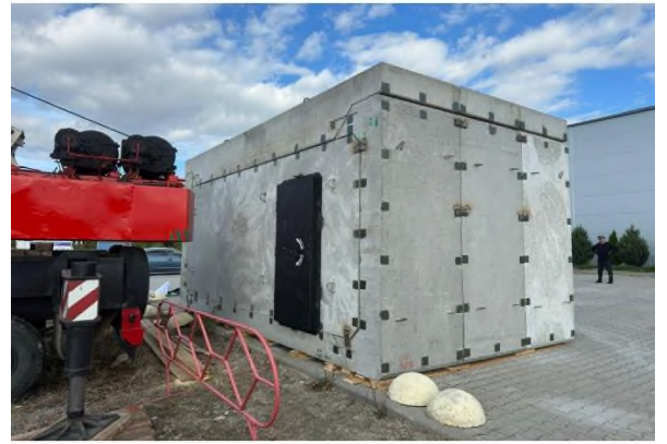
Первинне (мобільне) укриття та ПРУ (Протирадіаційне укриття)