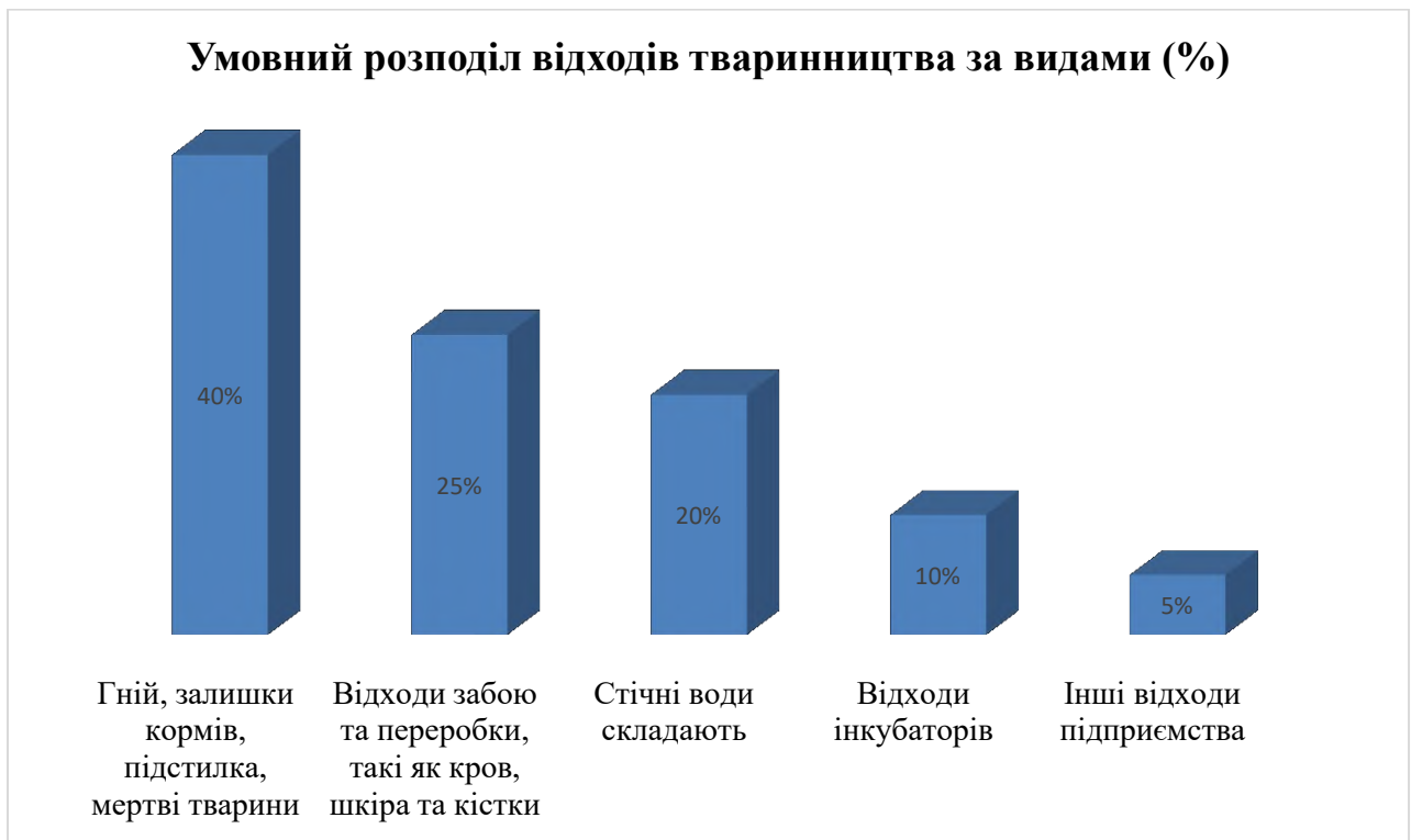
Рисунок 3.1 – Відсоткове співвідношення видів відходів тваринництва

Тваринницькі комплекси відповідно до екологічної класифікації належать до об'єктів підвищеного впливу на навколишнє природне середовище, що визначається концентрацією поголів'я, обсягами утворення органічних відходів та інтенсивністю використання інженерних систем. Згідно з вимогами ДБН В.2.2-1:2024 «Будівлі та споруди. Сільськогосподарські будівлі» [1], при проектуванні таких об'єктів обов'язково враховуються екологічні обмеження, пов'язані з розміщенням, технологією утримання тварин та системами утилізації відходів.