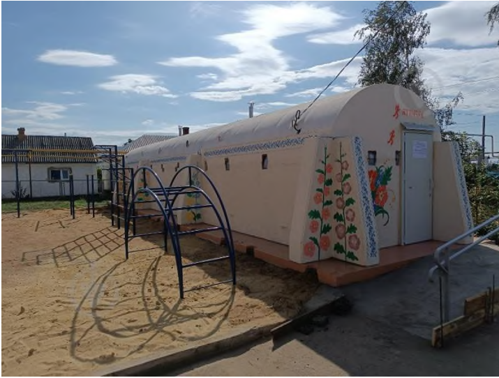
Модульне укриття цивільного захисту тип «Фортеця»