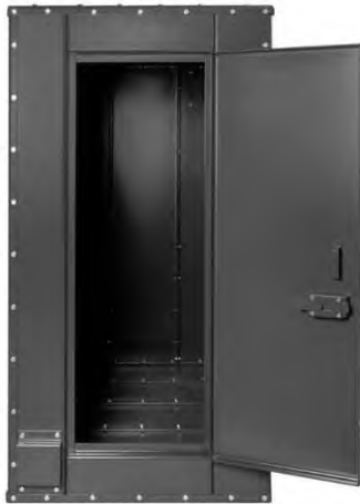
Захисний броньований модуль