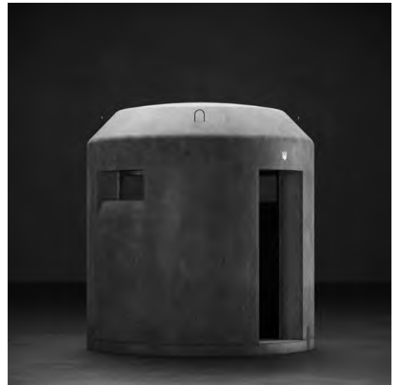
Вуличний модуль-укриття Dot

З точки зору планувально-конструктивної схеми більшість надземних мобільних укриттів виконуються як однокамерні або двокамерні об'єми з лінійною організацією внутрішнього простору. Вхід, як правило, розташовується з короткого або довгого боку модуля та обладнується посиленими дверима. Вихідні та вентиляційні елементи мінімізуються з метою зниження вразливості конструкції. У більш містких укриттях допускається застосування тамбурів або шлюзових зон.