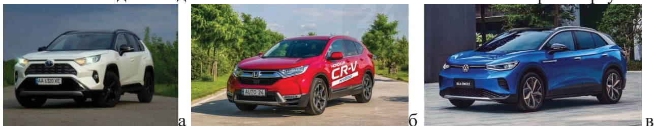
Рисунок 1 – Зображення кросовера: а) Toyota RAV4 Hybrid; б) Honda CR-V Hybrid, в) Volkswagen ID.4 Crozz

Автомобільний ринок України поповнюється автотранспортом сучасних конструктивних концепцій, що використовують альтернативні та нові види енергії, при покращених технічних параметрах. Зростає чисельний склад електрифікованих та гібридних автомобілів та відбувається збільшення транспортних засобів підвищеної вантажопідйомності та пасажиромісткості, а також вдосконалюється інфраструктура рухомого складу. В той же час витрати на обслуговування та ремонт автомобілів автотранспортних підприємств на станціях технічного обслуговування і на авторемонтних заводах залишається ще достатньо високими. У зв'язку з цим, виникає необхідність вдосконалити системи ТО та Р автомобільного транспорту.