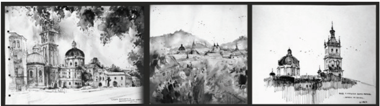
Рисунок 1 –Львівські архітектурні зарисовки автора

У даній статті взято зарисовки автора, які були створені під час подорожі до міста Львова (рис. 1).