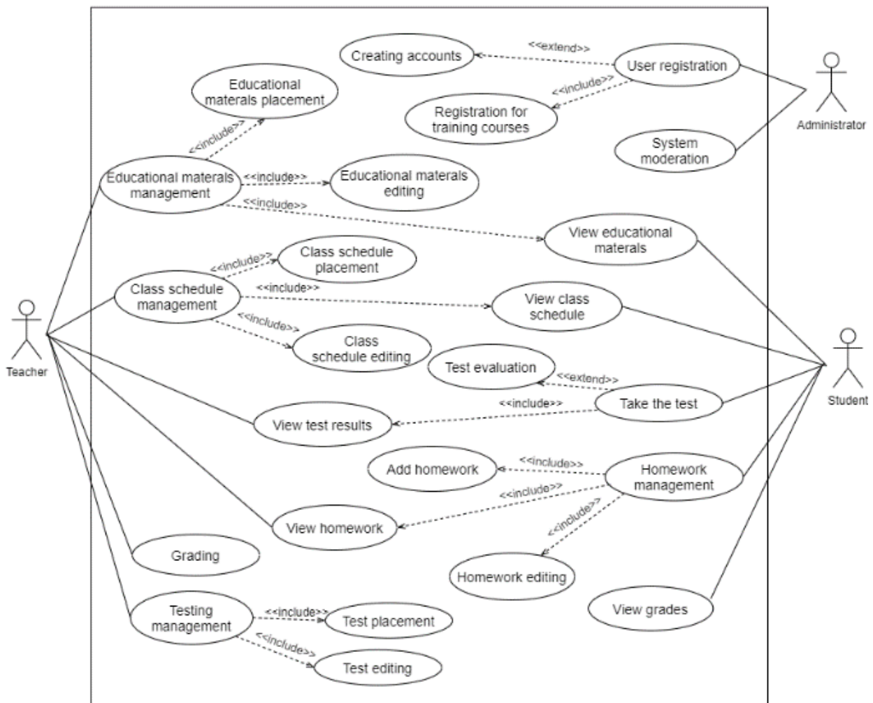
Fig. 3. The diagram of usage options

The diagram of usage options (Fig. 3) shows all the scenarios of working with the system and their connection with users.