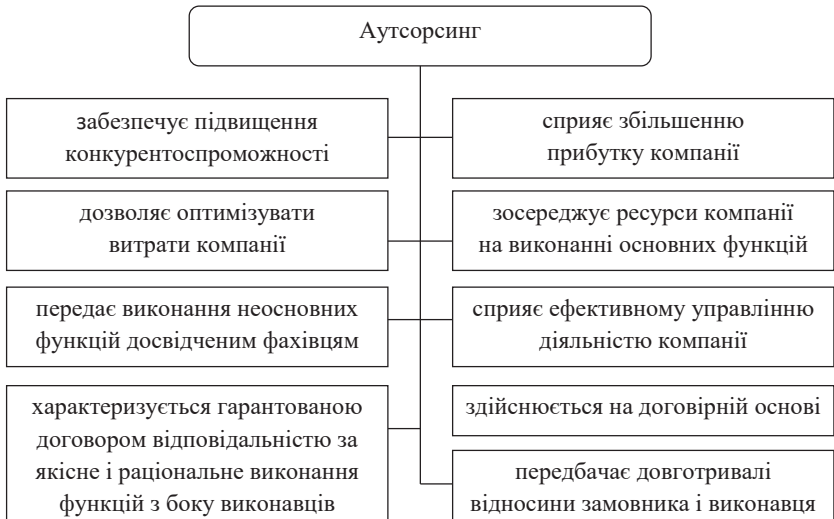
Рис. 2. Характерні риси аутсорсингу

Аутсорсинг бухгалтерського обліку є окремим видом аутсорсингу бізнес-процесів, одним із способів облікового забезпечення діяльності