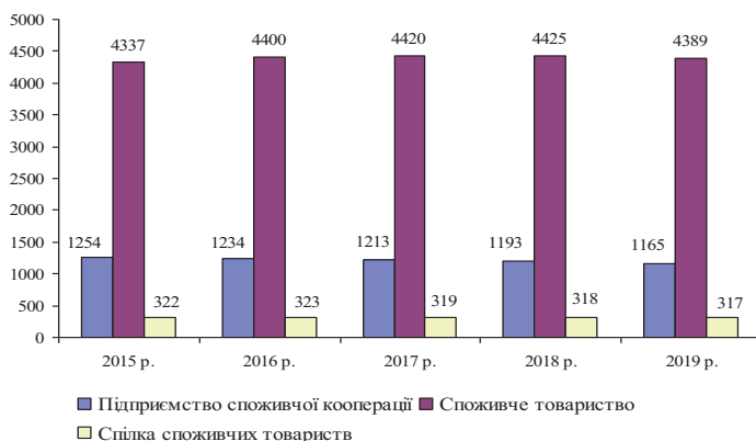
Рис. 1. Динаміка кількості підприємств споживчої кооперації, споживчих товариств та спілок споживчих товариств в Україні за 2015–2019 рр. (станом на кінець року) [1]

Впродовж досліджуваного періоду показникам була притаманна нестійка динаміка. Так, у період з 2015 р. по 2019 р. кількість підприємств споживчої кооперації зменшилася на 89 одиниць або на 7,1 % та спілок споживчих товариств на 5 одиниць або на 2 %, що пояснюється негативною загальною політичною і економічною ситуацією в Україні. Кількість споживчих товариств мала тенденцію до росту і за даний період зросла на 52 одиниці або на 1,2 %, що є позитивним в діяльності споживчої кооперації.