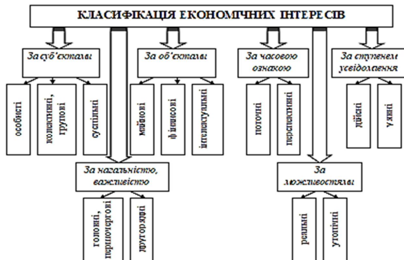
Рисунок 1 – Класифікація економічних інтересів за різними критеріями [1, с. 18]

Економічні інтереси можуть бути класифіковані за різними критеріями (рис. 1.1):