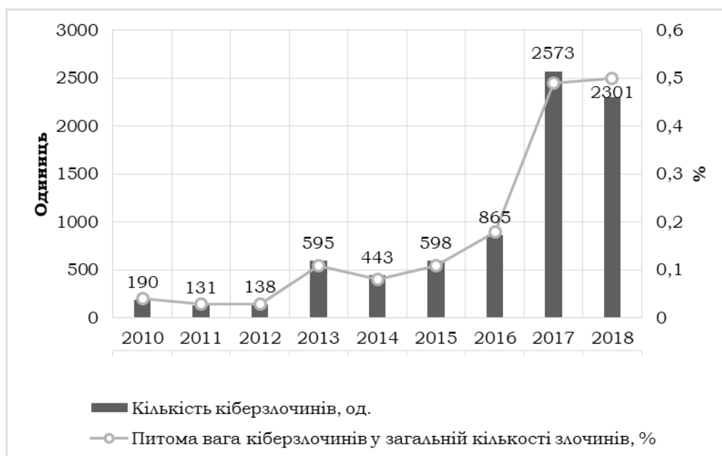
Рис. 2. Рівень та динаміка кіберзлочинів в Україні у 2010-2018 рр.

ської атаки за допомогою вірусної програми NotPetya склали 850 млн дол. США, з них 300 млн дол. США – фінансові втрати національної економіки України (0,4 % ВВП) (Державна служби спеціального зв'язку та захисту інформації України, 2020).