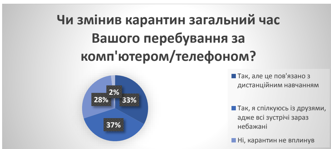
Рис. 5. Результати опитування молоді з питання «Чи змінив карантин загальний час Вашого перебування за комп'ютером/телефоном?» у % від загальної кількості досліджуваних

На питання «Чи змінив карантин загальний час Вашого перебування за комп'ютером/телефоном?» (рис. 5) отримано такі відповіді: «так, але це пов'язано з дистанційним навчанням» – 33% опитаних; «так, я спілкуюсь із друзями, адже всі зустрічі зараз небажані» – 37% ; «ні, карантин не вплинув» – 28% ; «свій варіант» – 2%.