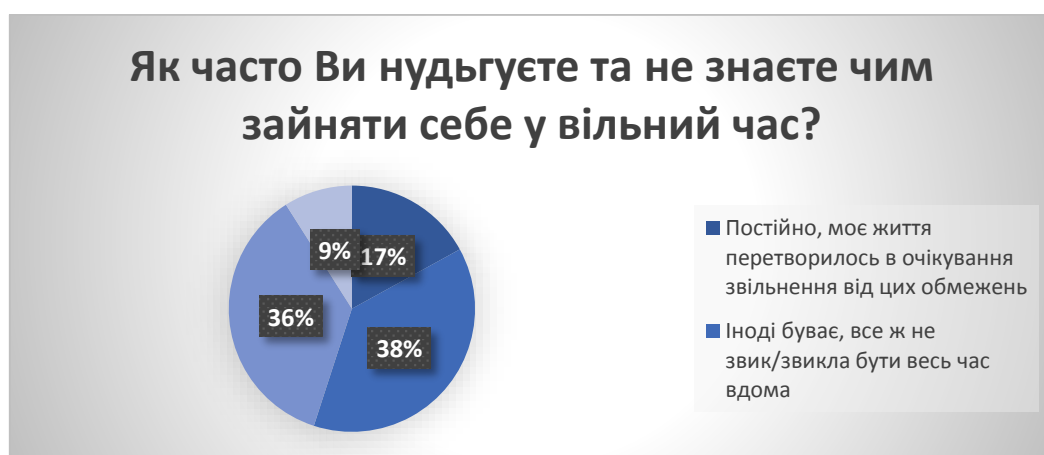
Рис. 4. Результати опитування молоді з питання «Як часто Ви нудьгуєте та не знаєте чим зайняти себе у вільний час?» у % від загальної кількості досліджуваних

На питання «Як часто Ви нудьгуєте та не знаєте чим зайняти себе у вільний час?» (рис. 4) отримано такі відповіді: «постійно, моє життя перетворилось в очікування звільнення від цих обмежень» – 17% опитаних; «іноді буває, все ж не звик/звикла бути весь час вдома» – 38% ; «майже ні, в мене є багато справ і хобі» – 36% ; «ні, бачу лише плюси від перебування вдома» – 9%.