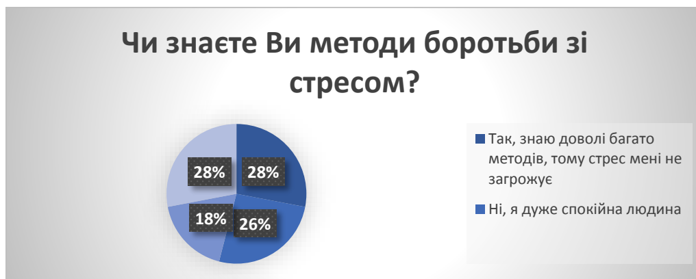
Рис. 9. Результати опитування молоді з питання «Чи знаєте Ви методи боротьби зі стресом?» у % від загальної кількості досліджуваних

Як видно з результатів, 28% молоді не знають методів боротьби зі стресом, але хочуть дізнатись; така ж кількість молодих людей відповіли, що досить обізнані у цьому питанні та поділилась із нами своїми методами, деякі з яких представлені нижче.