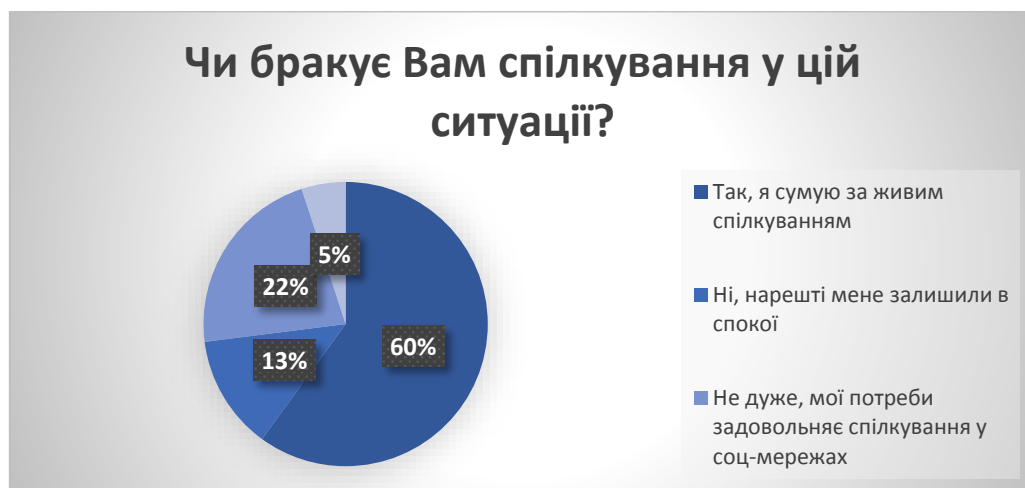
Рис. 2. Результати опитування молоді з питання «Чи бракує Вам спілкування у цій ситуації?» у % від загальної кількості досліджуваних

Таким чином, найбільша кількість молоді сумує за живим спілкуванням. Майже кожного п'ятого задовольняє спілкування у соц-мережах, решта радіє спокою.