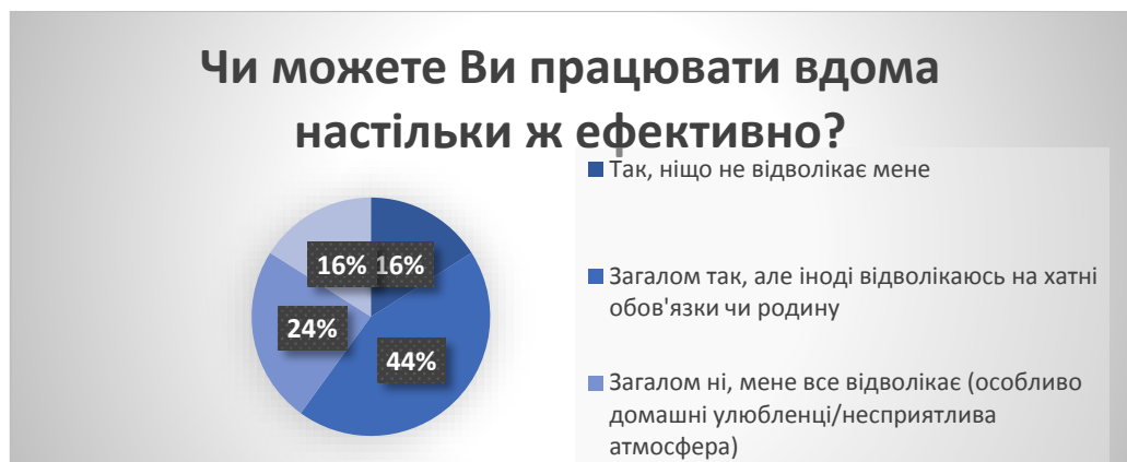
Рис. 8. Результати опитування молоді з питання «Чи можете Ви працювати вдома настільки ж ефективно?» у % від загальної кількості досліджуваних

На питання «Чи можете Ви працювати вдома настільки ж ефективно?» отримано такі відповіді (рис. 8): «так, ніщо не відволікає мене» – 16%