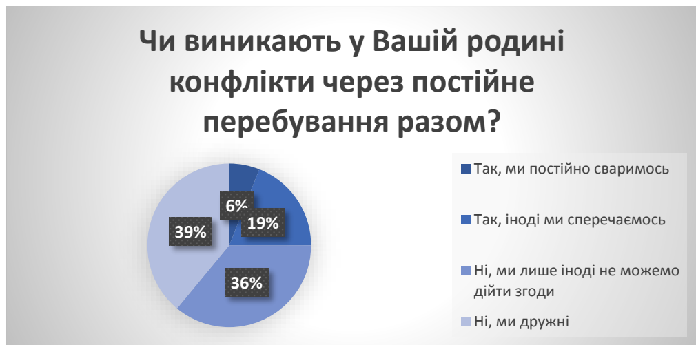
Рис. 7. Результати опитування молоді з питання «Чи виникають у Вашій родині конфлікти через постійне перебування разом?» у % від загальної кількості досліджуваних

Як видно з результатів, більшість сімей дружні, а іншим варто замислитись над стосунками з найріднішими людьми та почати працювати над цим.