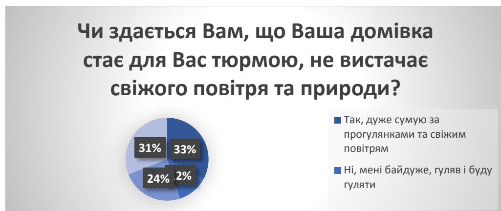
Рис. 3. Результати опитування молоді з питання «Чи здається Вам, що Ваша домівка стає для Вас тюрмою, не вистачає свіжого повітря та природи?» у % від загальної кількості досліджуваних

На питання «Чи здається Вам, що Ваша домівка стає для Вас тюрмою, не вистачає свіжого повітря та природи?» (рис. 3) отримано такі відповіді: «так, дуже сумую за прогулянками та свіжим повітрям» – 33% опитаних; «ні, мені байдуже, гуляв і буду гуляти» – 12% ; «ні, мені вдома пречудово» – 24% ; «так, але це необхідно, я піклуюсь про здоров'я» – 31%.