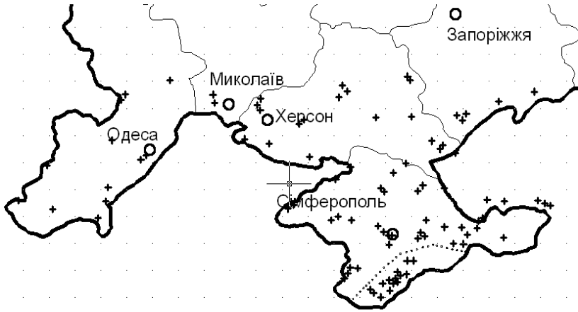
Рис.1 Мережа метеостанцій приморських територій України

До мережі не включені гірські метеостанції Криму, температурний режим яких значною мірою визначається висотою їх розташування над рівнем моря, що було показано й враховано в [2, 4].