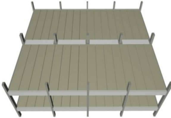
Рис. 2. Збірна сталезалізобетонна перекриття / Collected composite structures overlap

допомогою зварювання. Таке перекриття (рис. 1) складається із трубобетонних колон та сталезалізобетонних плоских плит зі сталевим обрамленням. При цьому виготовлення збірних плит зі сталевим обрамленням для безбалкового перекриття може виконуватись безпосередньо на будівельному майданчику без застосування дорогої за вартістю опалубки [2, 4].