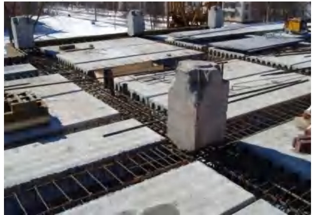
Рис. 1. Каркас перекриття системи типу АРКОС / Frame flooring systems such ARKOS

На теперішній час широко розповсюджені в будівництві безбалкові, без капітельні та безригельні конструкції покриття перекриття. Зокрема такі конструктивні системи типу КУБ 2.5, АРКОС (рис.1), СОЧИ, РАДИУСС, конструктивна схема по серії 1.020-1/83, та ін.