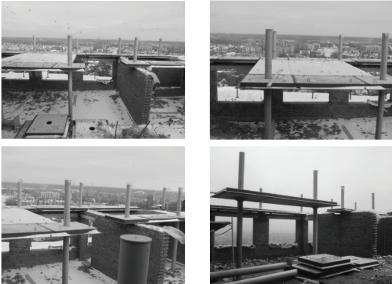
Рис. 3. Монтаж сталеалізобетонного безбалкового перекриття