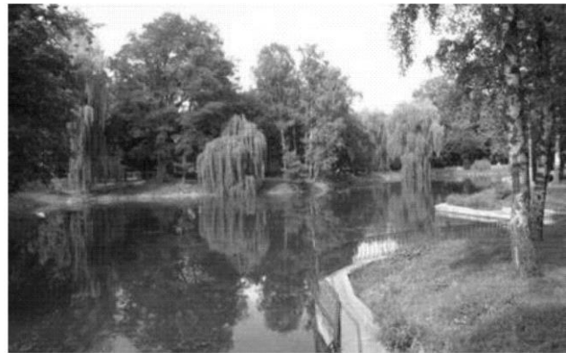
б - Парк Шевченко у м. Івано-Франківськ. Україна