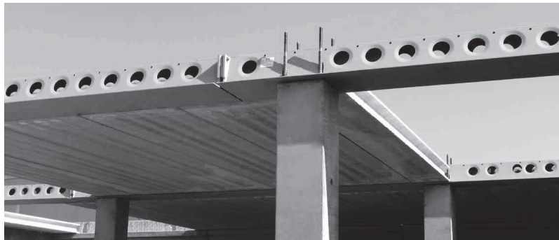
Рис. 2. Збірно-монолітний каркас Delta в процесі зведення

Виготовлення ригелів пов'язано з високими фінансовими затратами, так як для виконання суцільнозварних гнутих профілів трапецієвидного поперечного перерізу з виштампуваними на бічних гранях отворами (рис. 2) застосовується спеціальне технологічне устаткування (плазмовий різак) з високоточним роботизованим зварюванням класу С за EN ISO 5817.