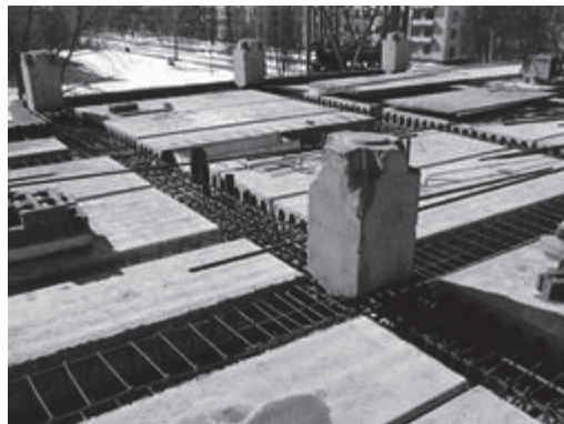
Рис. 3. Будівля конструктивної системи «АРКОС» в процесі зведення

Диски перекриттів мають гладку стелю. При прольотах завтовшки до 6 м у житлових будівлях несучі ригелі виконують прямокутними висотою в межах товщини збірних плит (220 мм), при збільшенні прольотів до 7,2 м включно ригелі мають тавровий переріз (260 мм) з полицею над плитами в межах стяжки над місцем спирання плит на ригель.