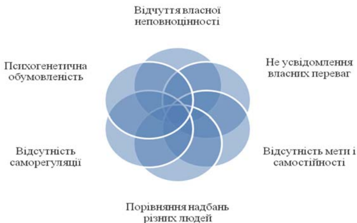
Мал. 2. Структура розвитку заздрості особистості

Структура розвитку заздрості особистості передбачає такі компоненти (див. малюнок 2):