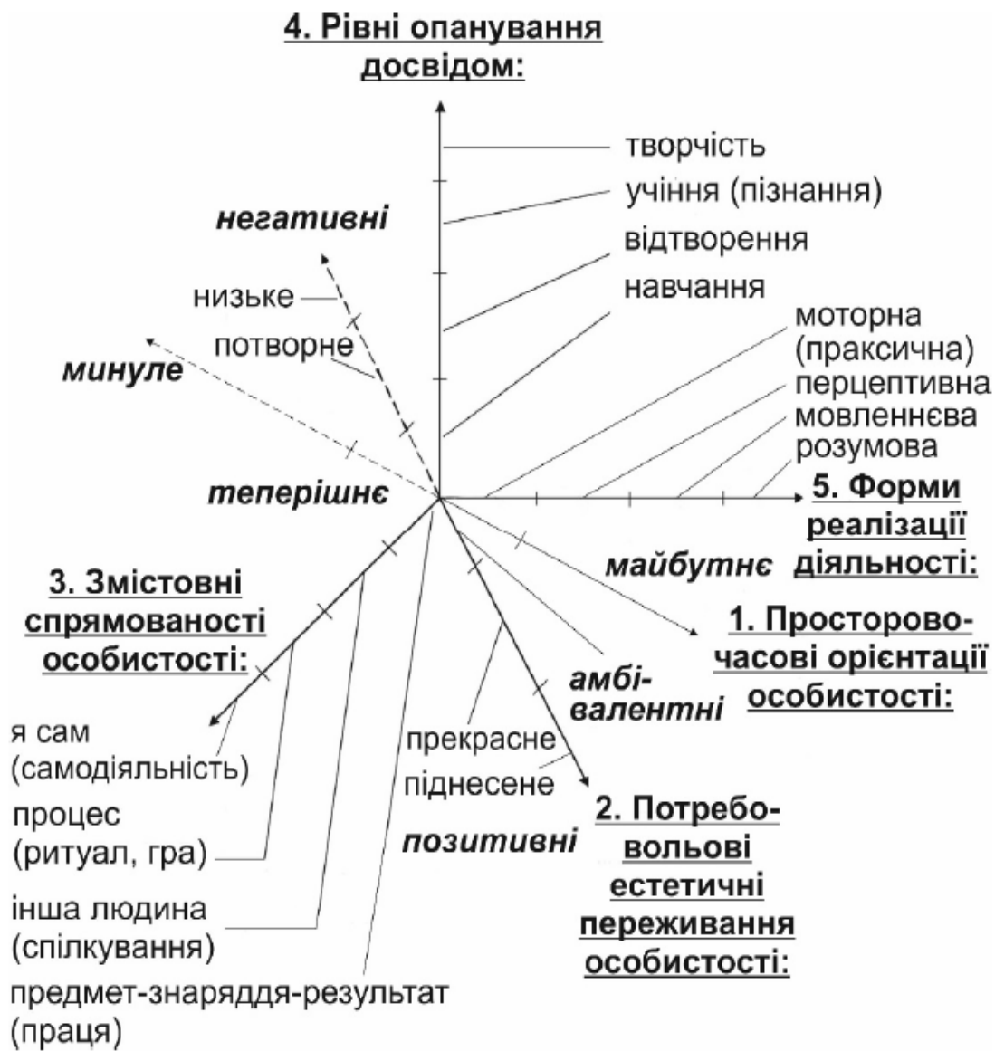
Рис. 1. Схематическое изображение многомерной структуры личности (по В.Ф. Моргуну)

зображення багатовимірної структури особистості (див. нижче рис. 2).