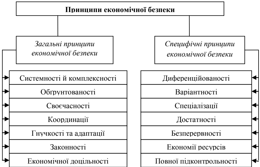
Рис. 1. Принципи економічної безпеки [сформовано авторами]

Далі ми більш детально зупинимося на кожному із принципів.