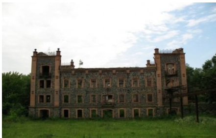
Рис.7. с. Сокілець. Річка Південний Буг.

З давніх-давен в Україні селяни будували водяні млини, які переважно використовували для помелу борошна. Найбільше їх було і зберіглося донині на річках Південний Буг і Рось та на їхніх притоках.