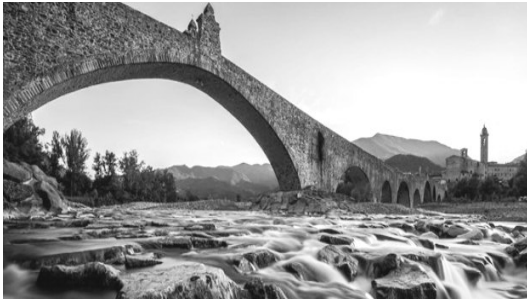
Рис.5. Міст через гірську річку

будинки, святіші за храми. Вони належать усім і для всіх однакові, вони корисні, вони збудовані завжди осмислено, на тих місцях, де вони найпотрібніші. Вони довговічніші за інші будівлі й не служать нічому прихованому чи злему.