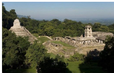
Рис.4. Паленке, Мексика

Серед усього, що людина в житті зводить і будує, на наш погляд, немає нічого кращого й вартіснішого від мостів. Вони важливіші за