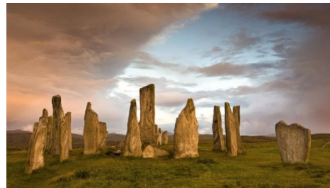
Рис. 2. Менгіри

Скільки всього на нашій планеті існує загублених міст, точно не знає ніхто. Але ті, які археологам вдається виявити, незмінно викликають величезний інтерес. Ось приклади найвідоміших міст з каменю.