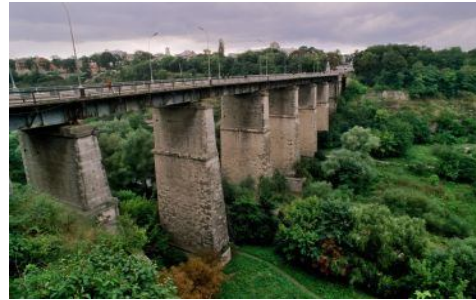
Рис.6. Новопланівський міст

З давніх-давен в Україні селяни будували водяні млини, які переважно використовували для помелу борошна. Найбільше їх було і зберіглося донині на річках Південний Буг і Рось та на їхніх притоках.