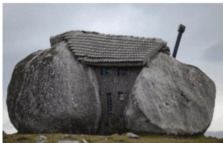
Рис.9. Кам'яний будинок у Бразі

Далеко не кожен житель нашої планети наважиться на будівництво кам'яного будинку.