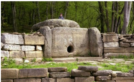
Рис. 1 Дольмен

Кам'яні будівлі і споруди існували ще в доісторичні часи. Грубе оброблення каменю виконувалось у бронзовий період при спорудженні культових споруд - дольменів і менгірів — вертикально поставлених кам'яних блоків.