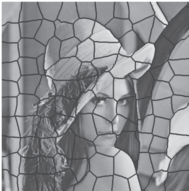
Рис.3. Вариант разбиения изображения на произвольные суперпиксели

на регулярные и идентичные по форме блоки, а по аналогии с задачей распознавания рукописей – на "суперпиксели" различной конфигурации [5, 6], по принципу разбитого зеркала (рис.3).