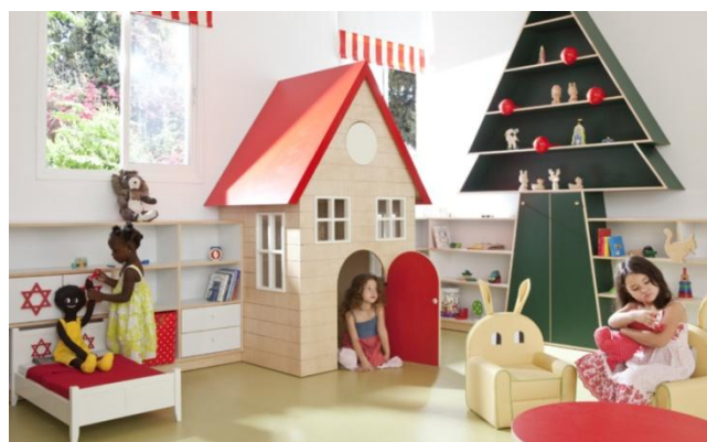
Рис. 1. Приклади створення мікрозон для усамітнення. Творчий простір дитячого саду у м. Рамат-Ган, Ізраїль, дизайнер Саріт Шані Хей [4]

В ігрових кімнатах меблі, як правило, заповнюють весь периметр приміщення з метою залишити максимально вільним простір для гри і навчання дітей. Однак, середовище повинно бути мобільним, багатофункціональним та мати можливості для трансформації. Це пов'язане із «сезонністю» освітньої програми, змінністю функціональних процесів та з