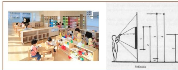
Рис. 3. Прийоми предметно-просторової організації інтер'єрів закладів дошкільної освіти