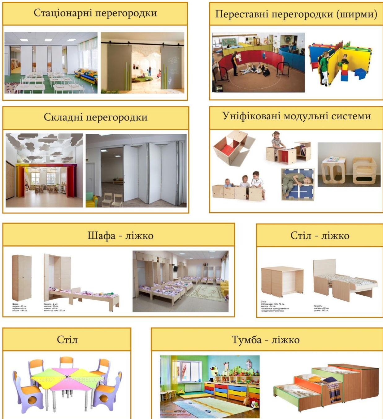
Рис. 2. Варіанти трансформації простору та меблів у закладах дошкільної освіти

можливістю додавання нових функціональних зон. Тому застосування багатоваріантного наповнення: «м'яких модулів», трансформованих меблів та перегородок дозволить урізноманітнити стандартне вирішення інтер'єру, надасть йому сучасних ознак, допоможе змінювати простір залежно від виду діяльності, зробить його динамічним і цікавим (рис. 2).