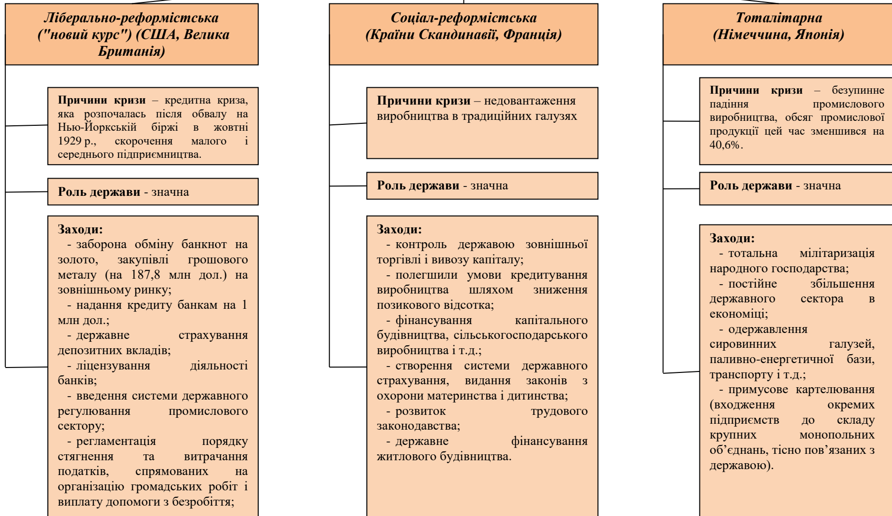
Рис. 2 – Основні напрямки економічної політики з подолання кризи 1929-1933 років