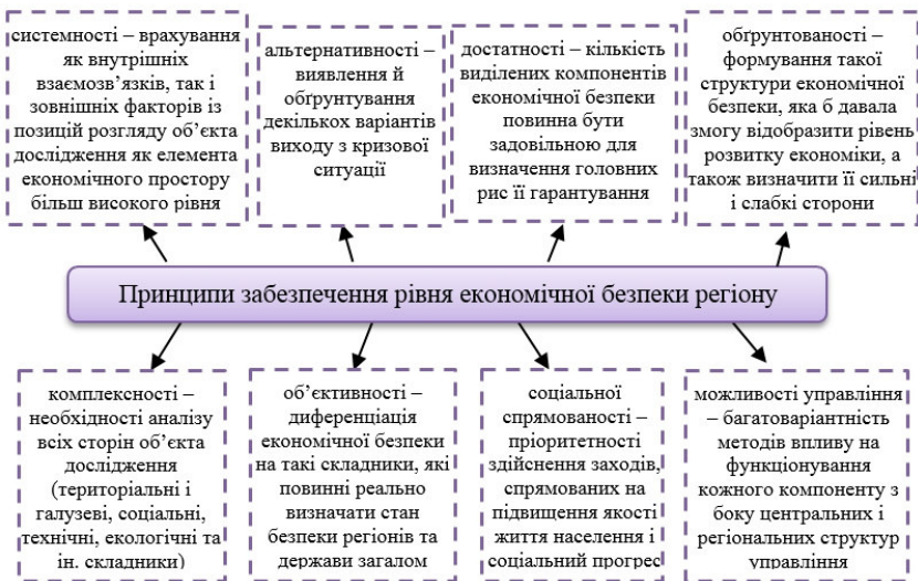
Рис. 2. Принципи забезпечення економічної безпеки регіону

здатність регіональної економічної системи до самовідтворення та саморозвитку – можливість регіону забезпечувати відтворювальні процеси, задовольняти потреби населення, дотримуватися концепції сталого розвитку регіональної системи;