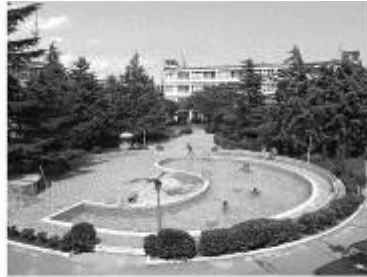
Рис. 4 «Висхід»