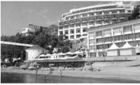
Рис. 3 «Літо»