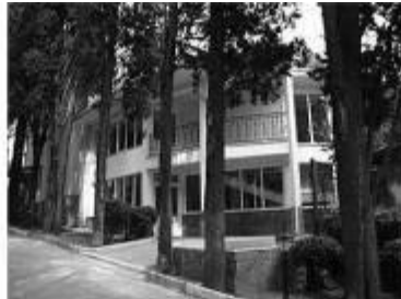
Рис. 2 "Магнолія"