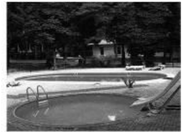
Рис. 2.1 "Магнолія"

Характерною особливістю плавучих комплексів для туристів є можливість буксирування у будь який район міста. У плавучих містах передбачається високий рівень обслуговування водних туристів та їх плавзасобів. У закладах цих комплексів забезпечується в повному обсязі культурний відпочинок та обслуговування туристів. «Гідрополіс» (Нідерланди) побудований у вигляді величезної піраміди. В цілому вигляд Гідрополіса створюється терасоподібними спорудами, розташованими як злами із прямими кутами, які утворюють напівзамкнутий простір гавані [5]. Архітекторами Н.Бургесом та Кітутаке запроектовано плавучий туристичний комплекс з виставковим центром для будівництва США біля Гавайських островів. Він складається з 28 віялоподібних конструктивних елементів-модулів, розташованих на платформах-понтоніах. У деяких комплексах водного туризму за кордоном використовуються декоративні засоби, які надають будівлям подібності до кораблів.