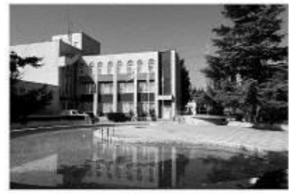
Рис. 4.1 «Висхід»

великий туристичний центр України, край паломництва шанувальників активного відпочинку, які приїждять з багатьох країн світу. До їх послуг десятки туристично-екскурсійних закладів: комплекси, готелі, турбази, притулки, кемпінги.