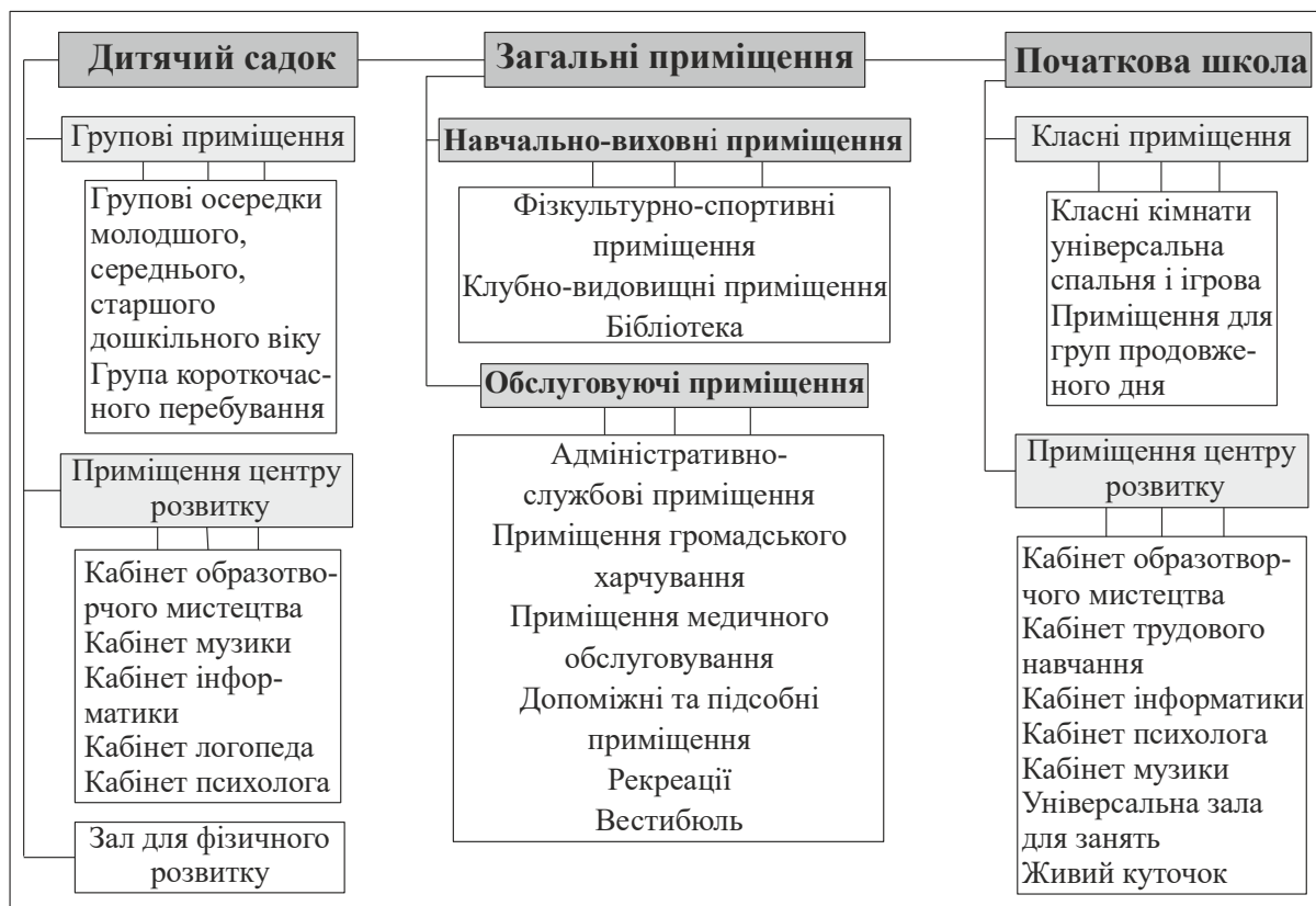
Рисунок 3 – Функціональна схема НВК «Дитячий садок – початкова школа»

(вестибюль, туалетні (0,65), гардеробні (0,2), кімната охорони), класом-ігровою (2,4), універсальними спальнями (2,0), рекреаціями (2,0).