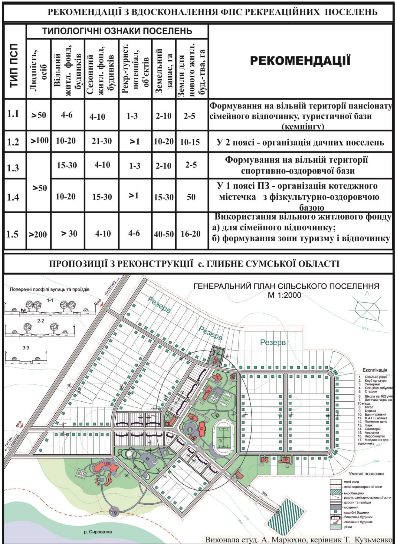
Рис. 2. Рекомендації з вдосконалення ФПС рекреаційних поселень