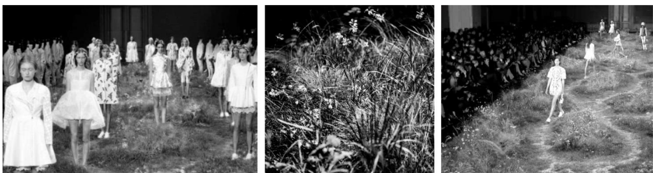
Рисунок 2. Показ Moncler Gamme Rouge весна-літо 2016, Париж.

Показ мод Moncler Gamme Rouge в Парижі (рис. 2) пройшов на подіумі вкритому травою, злаками та польовими рослинами, колекція одягу демонструвала легкі весняно–літні фасони суконь, що були підкреслені вишуканим вирішенням площини подіумного покриття. В показі з колекції Dior Олександр де Бетак створює імпровізацію природного утворення — гори вкритої квітами. В першому випадку застосовано прийом використання ґрунту та рослинності, в другому, імітація природних утворень. Також, автор виділяє такі прийоми використання озеленення в вирішенні подіумного простору: покриття горизонтальної поверхні мохом (Dries van Noten, Париж, 2015 рік); озеленення групами чагарників (Dior, Париж); оздобленні вертикальних площин квітами (Dior, Париж); використання вертикального озеленення; ампельні рослини на стелі (Олександр де Бетак, Dior, Париж).