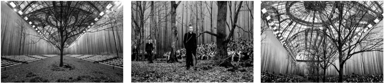
Рисунок 1. Дизайн подіумного простору в Гран-Пале, Париж, показ Chanel осінь-зима 2018/19.

його одяг. Даний приклад вирішення подіумного простору демонструє прийом використання ґрунту та озеленення (рис. 1).