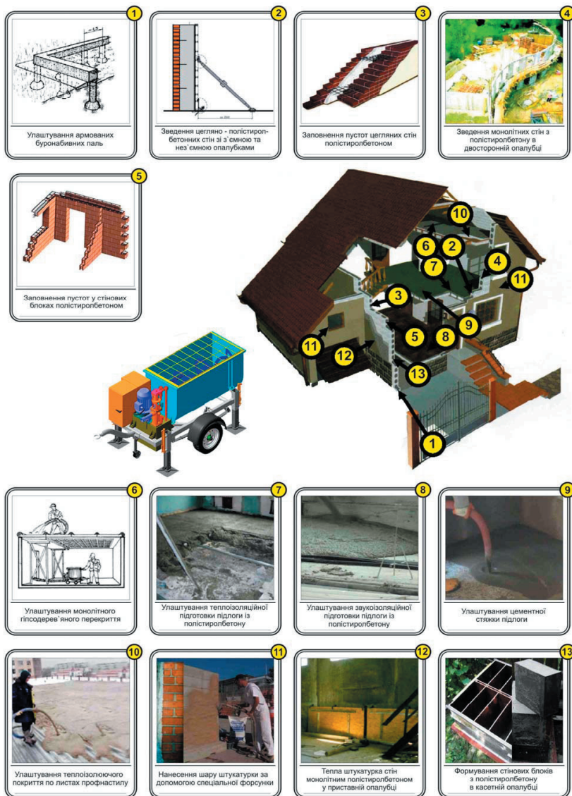
Рис 2. Сфери застосування мобільної розчинозмішувальної установки із гідравлічним приводом [ 1 ]

На рис.2 наведено основні сфери застосування мобільної розчинозмішувальної установки із гідравлічним приводом при будівництві котеджів: