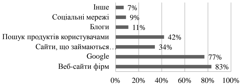
Рис. 2 – Відсоток покупців B2B, які використовують онлайн-інструменти для пошуку продуктів (побудовано автором на основі [3])

Щодо операцій за допомогою системи SWIFT, то їх обсяг також постійно змінюється. На рис. 3 зображено помісячну динаміку кількості повідомлень, якими оперувала система SWIFT протягом 2015-2017 рр.