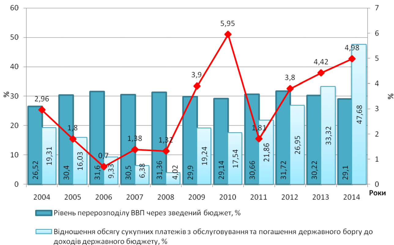
Рис. 1. Динаміка показників бюджетної безпеки України за 2004-2014 рр.

Показник дефіциту бюджетних та позабюджетних фондів сектору загальнодержавного управління значно коливається протягом 2000-2014 рр., тому прослідкувати чітку тенденцію неможливо. Оскільки найефективнішим значенням даного показника є його наближення до 0, то у зв'язку з цим можна відзначити, що найбільш раціонально проводилась бюджетна політика у 2013 та 2014 рр., коли дефіцит бюджетних та позабюджетних фондів сектору загальнодержавного управління склав -0,05 та 0,06 % до ВВП відповідно. Найменше значення даного показника було зафіксоване у 2005 р. (-0,37 % до ВВП), а найбільше – у 2009 р. (2,02 % до ВВП), а це негативно впливає на стан бюджетної безпеки країни. Такий значний відрив від оптимального значення даного показника у 2009 р. пояснюється наслідками світової економічної кризи 2008-2009 рр., яка негативно вплинула на ефективність управління державними фінансами. Слід відмітити, що протягом останніх років (2011-2014 рр.) прослідковується позитивна динаміка до наближення дефіциту бюджетних та позабюджетних фондів сектору загальнодержавного управління до оптимального значення, що свідчить про виважену, раціональну та ефективну бюджетну політику України та покращує на рівень бюджетної безпеки.