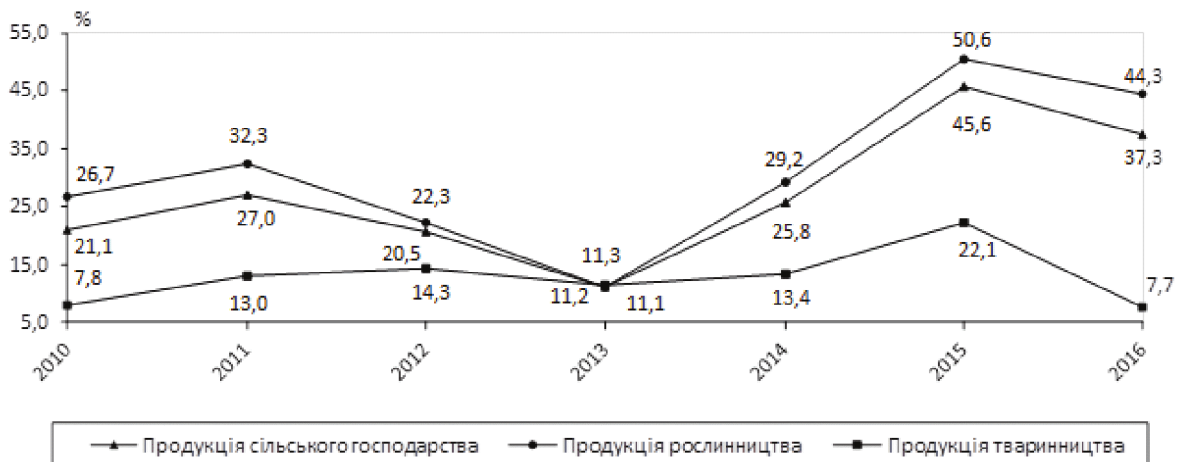
Рис. 1. Динаміка рентабельності виробництва сільськогосподарської продукції за 2010—2016 рр.

Так, 2016 року рентабельність виробництва продукції сільського господарства в цілому становила 37,3 % (2013 р. — 11,2 %), у тому числі виробництва продукції рослинництва — 44,3 % (2013 р. — 11,3%), продукції тваринництва — 7,7% (2013 р. — 11,1%). Спостерігається суттєве зростання показника сфери рослинництва, тоді як у тваринництві — повний занепад.