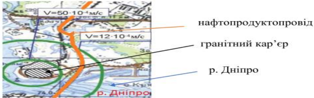
Рисунок 5 – Вплив гранітного кар'єру на нафтопродуктопровід: — ізосейми зон техногенного впливу; [hatched] – території кар'єрів [cross-hatched] – території промислових підприємств.

Згідно карт сейсмічного районування України ОСР-2004 дана територія відноситься до зони 5-ти