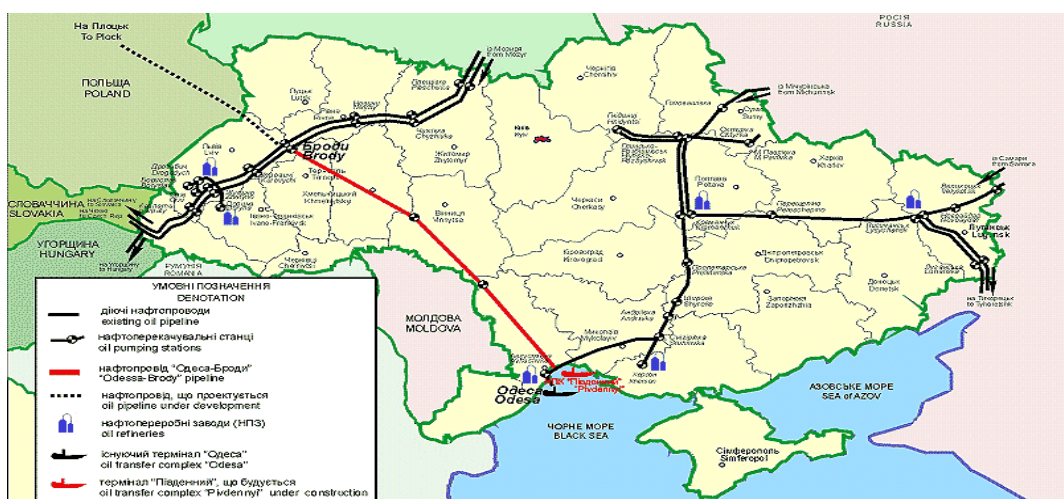
Рисунок 3 – Мережа магістральних нафтопроводів України.

Традиційно територія області вважалась природно асейсмічною. В 20 сторіччі на території області