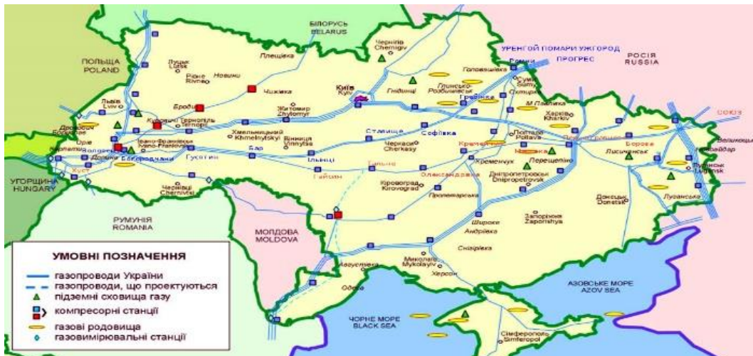
Рисунок 2 – Мережа магістральних газопроводів України.

На території області існує розгалужена мережа магістральних газо- та нафтопроводів (рис. 2, рис. 3 [10]), а також мережа автомобільних та залізничних доріг, потужні промислові підприємства гірничодобувної, нафтопереробної, металургійної, машинобудівної та будівельної галузей.