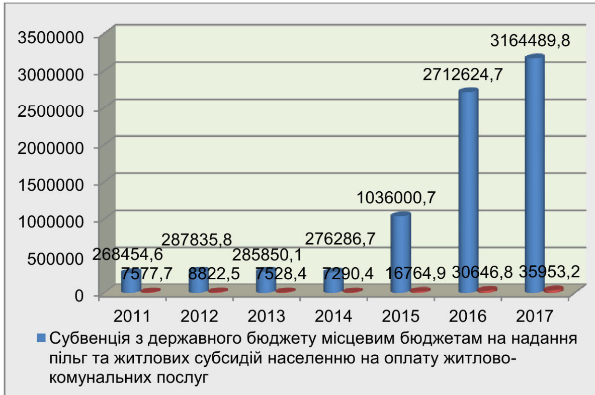
Рис. 3. Динаміка фінансування програм соціального захисту населення Полтавської області, пов'язана з витратами на житлово-комунальні послуги, протягом 2011-2017 рр., тис. грн.

Динаміку фінансування програм соціального захисту населення Полтавської області, пов'язану з витратами на житлово-комунальні послуги протягом 2011 – 2017 рр., показано на рис. 3.