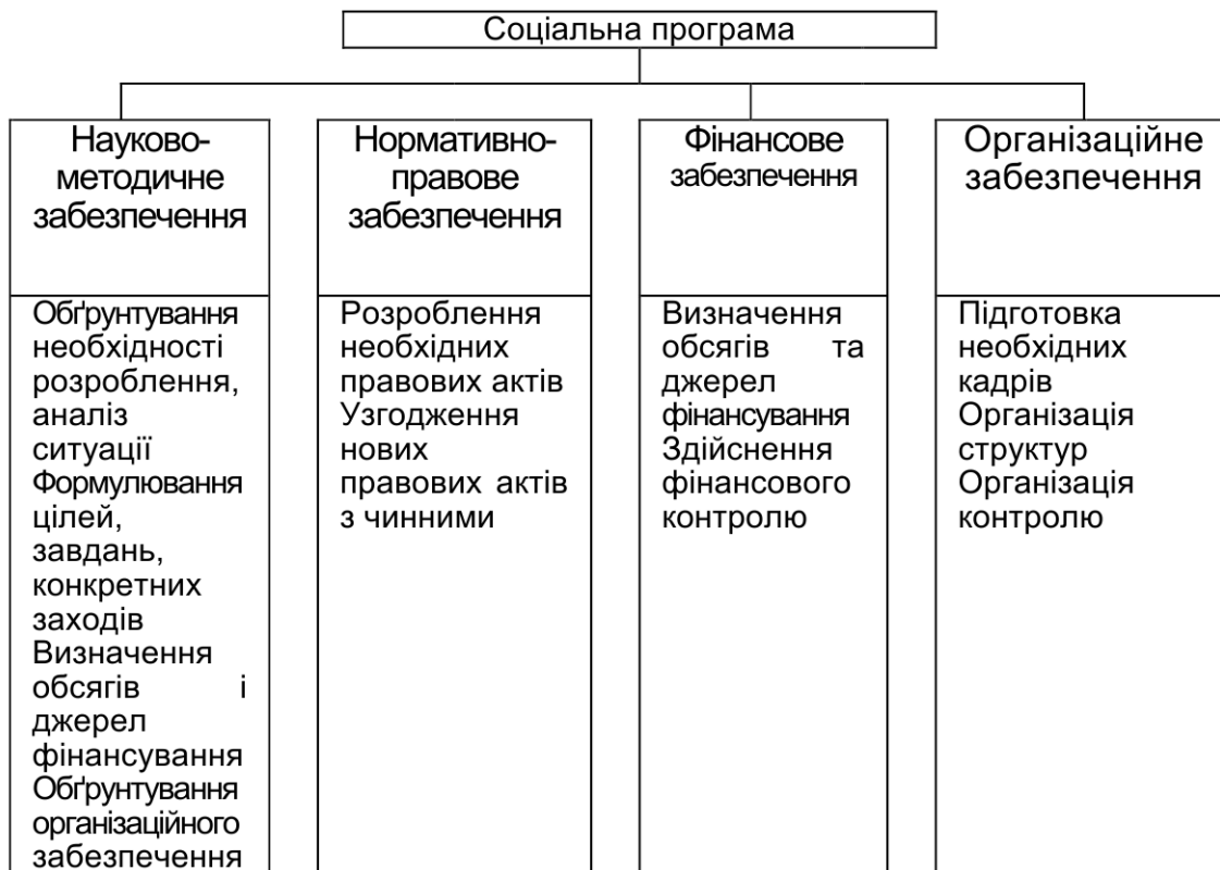
Рис. 1. Узагальнена структурно-організаційна схема соціальної програми [12]

розроблення та прийняття соціальної програми; реалізація програми; моніторинг і оцінювання програми; прийняття рішень щодо доцільності продовження програми, її коригування або згортання [12].