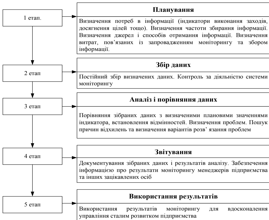
Рис. 1. Етапи організації моніторингу в системі управління сталим розвитком підприємства

Система моніторингу в системі управління сталим розвитком підприємства є сукупністю значущих для керівників підприємства показників, за динамікою яких відбуваються постійні спостереження і контроль, на основі яких ухвалюються рішення щодо розвитку підприємства. Якісно організована