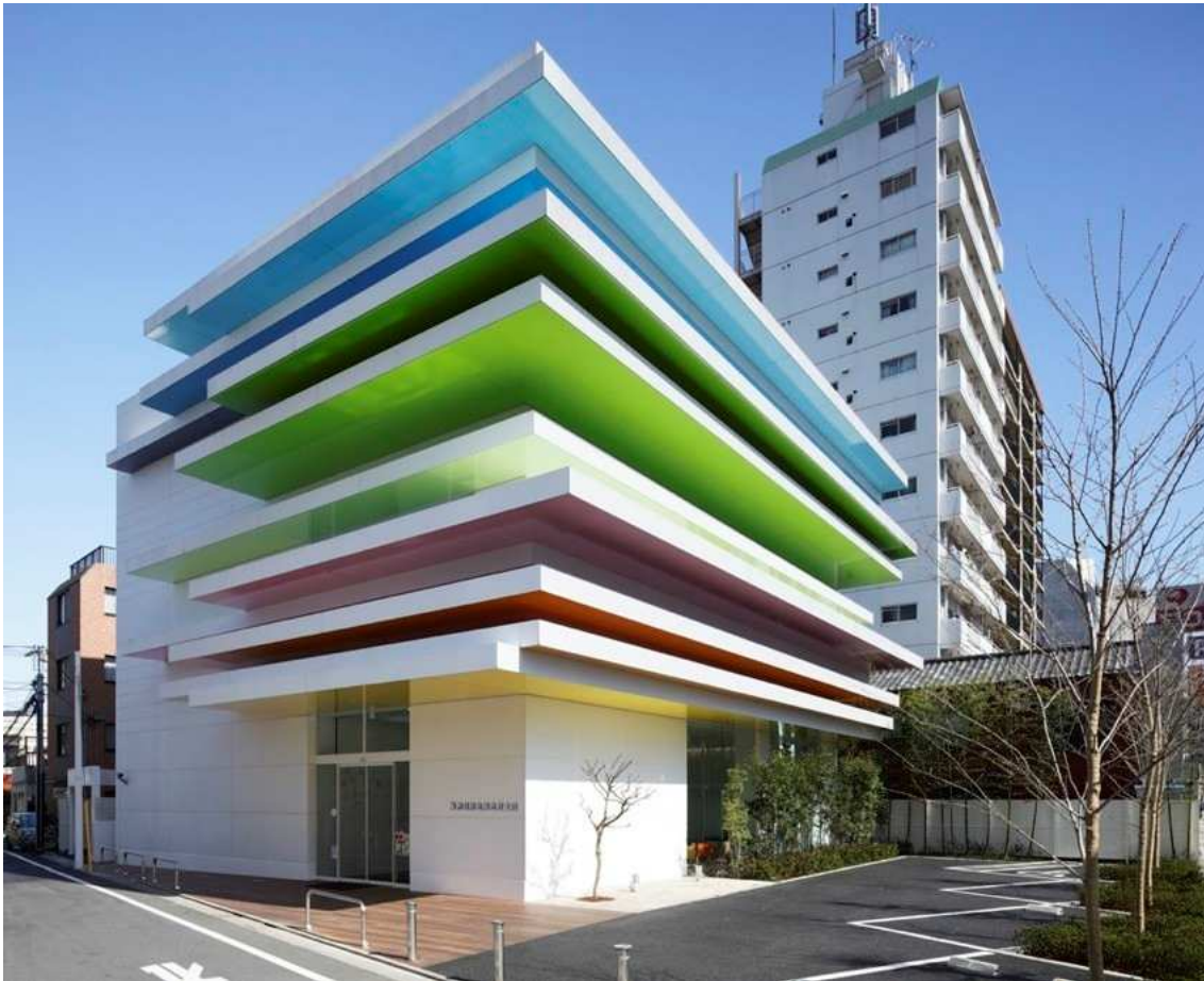
Рис. 1. Банк Sugamo Shinkin у Токіо. Emmanuelle Moureaux

Колір візуально збільшує або зменшує розміри. Приміщення із стінами світлого ненасиченого кольору, наприклад білого, здається більш просторим, ніж таке саме приміщення із стінами темного насиченого кольору. Традиційна рекомендація, яка випливає з цього – малогабаритні приміщення (кухні, ванни тощо) не слід облицьовувати плитками чорного, темно-синього або темно-зеленого кольору.