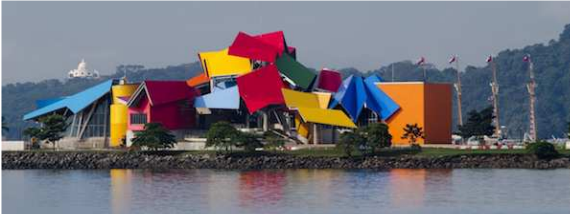
Рис. 2. Музей Biomuseo у Панамі. Френк Гері

Крім того, колір – найпростіший спосіб виділити будівництво із загальної маси, зробити його до певної міри видатним, не вдаючись до унікальних об'ємно-просторовим і конструкторським ходам.