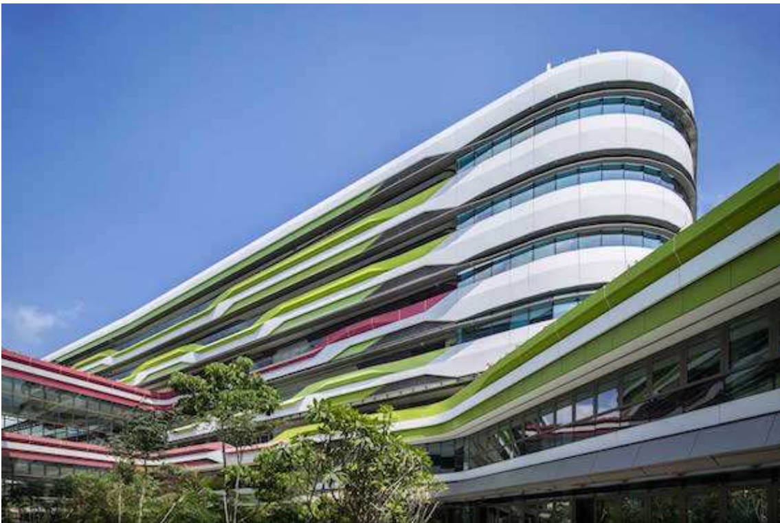
Рис. 6. Інститут дизайну і технологій SUTD. UNStudio і DP Architects