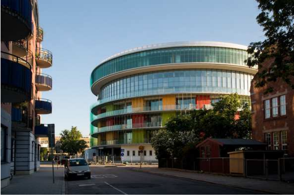
Рис. 5. Відділення реанімації, травматології та інфекційних хвороб у Мальме. С.Ф. Moeller