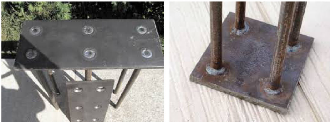
Рис. 1. Загальний вигляд закладних деталей, виготовлених у заводських умовах

Якісне приварювання анкерних стрижнів вимагає високої кваліфікації зварювальників та постійного контролю зварних швів.