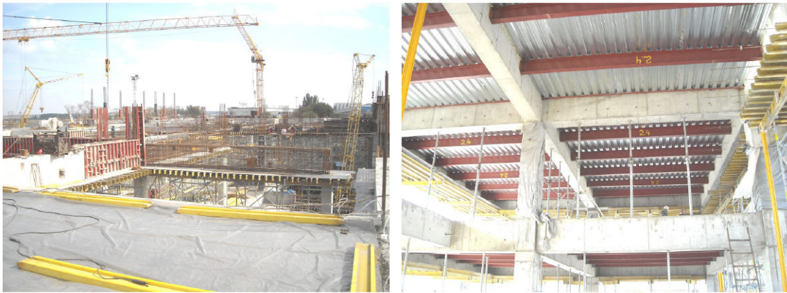
Рис. 3. Сталезалізобетонне перекриття нового терміналу в аеропорту міста Донецьк

Останнім часом ця технологія все частіше використовується в практиці вітчизняного будівництва. Яскравим прикладом її використання є будівництво нового терміналу в аеропорту міста Донецьк.