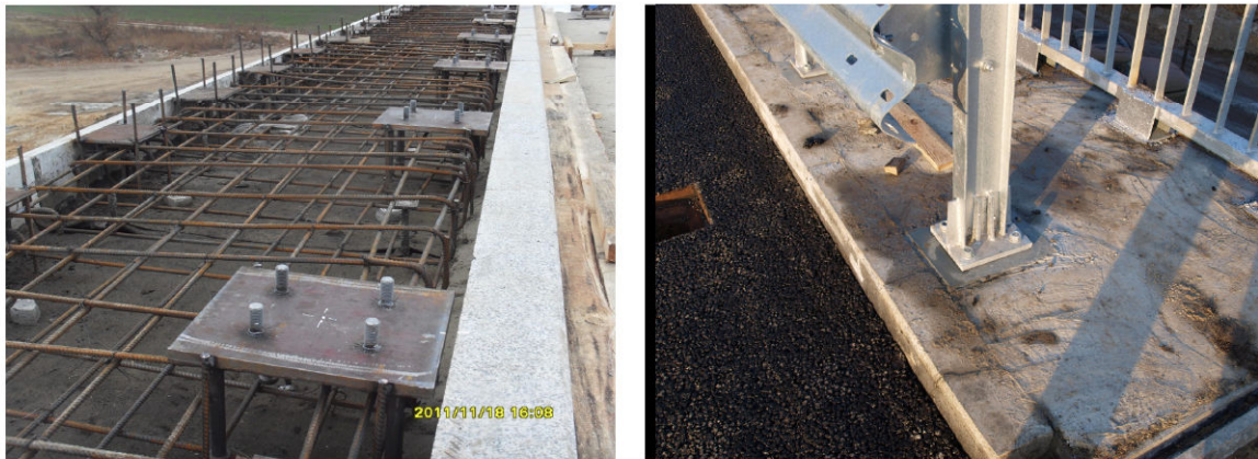
Рис. 5. Закладні деталі бар'єрного огороження шляхопроводу

На рисунку 5 наведено приклад приварювання шпильок до закладних деталей для кріплення бар'єрного огороження шляхопроводу в місті Дніпропетровськ.