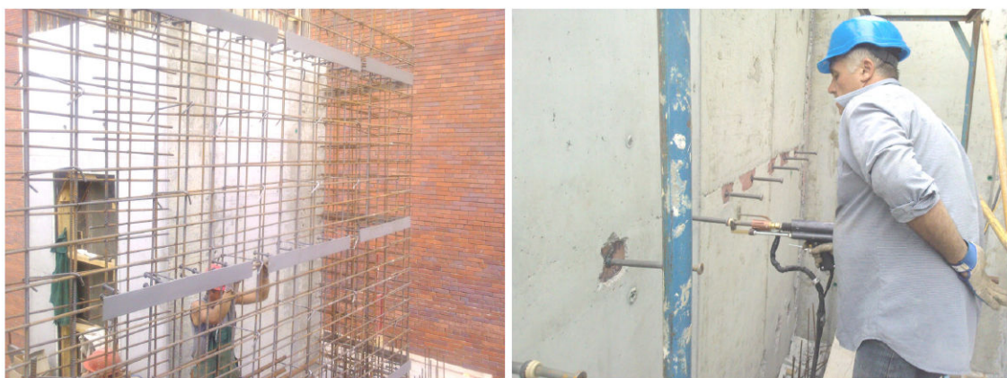
Рис. 4. Улаштування монолітної стіни із закладними деталями та наступне приварювання до них анкерних стрижнів

При монолітному чи збірно-монолітному будівництві з'являється можливість приварювати елементи кріплення до закладних деталей після бетонування конструкцій, що дозволяє використовувати уніфіковану інвентарну опалубку. Прикладом такого приварювання є будівництво житлового комплексу в місті Дніпропетровськ. Анкерні стрижні для кріплення утеплювача та фасадної частини стіни приварювалися до закладних деталей монолітної стіни (рис. 4).