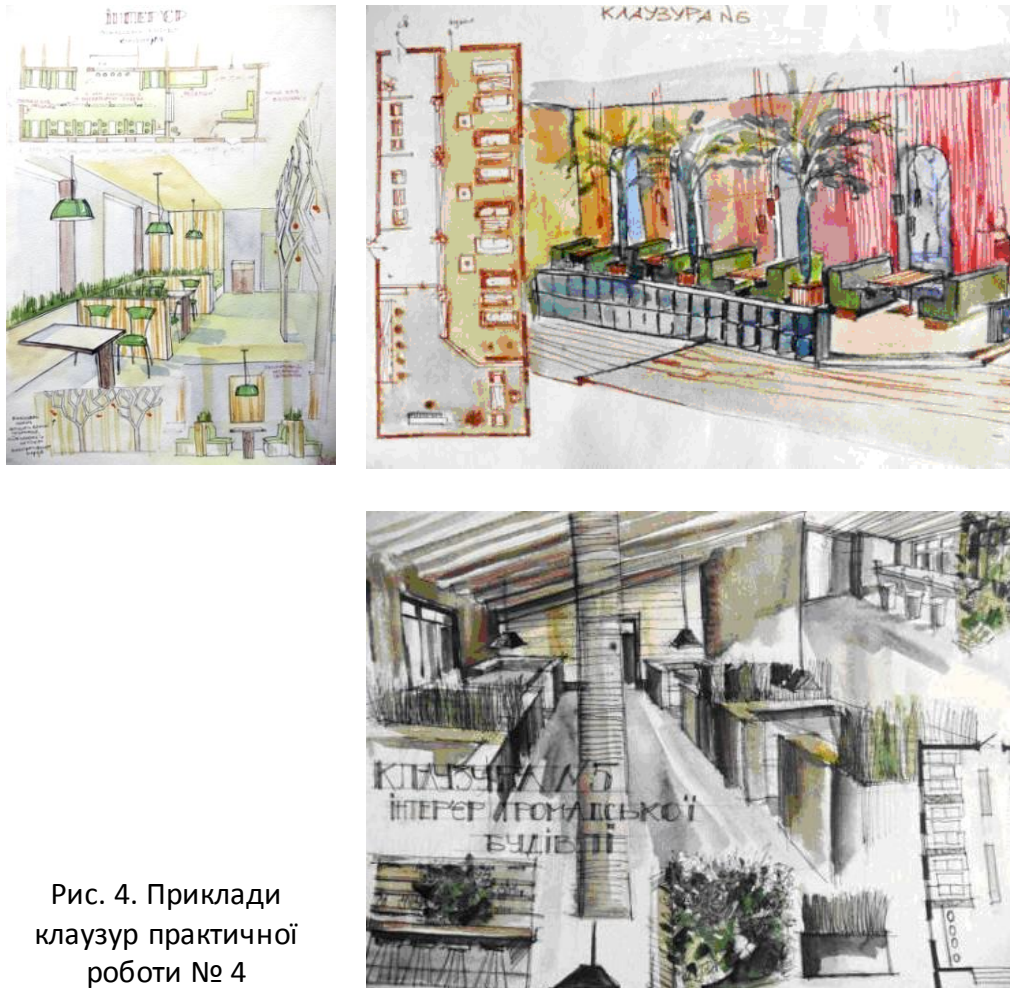
Рис. 4. Приклади клаузур практичної роботи № 4

4. Формування інтер'єру громадської будівлі (підприємства обслуговування, громадського харчування, культурно-розважальних закладів). Проектування інтер'єру громадської будівлі виконати на прикладі підприємства громадського харчування (ресторану). Зважаючи на те, що просторова структура громадських будівель поділяється на дві основні зони – службова та громадська, у даній роботі потрібно приділити увагу саме зоні для відвідувачів та запроєктувати інтер'єр основного приміщення.