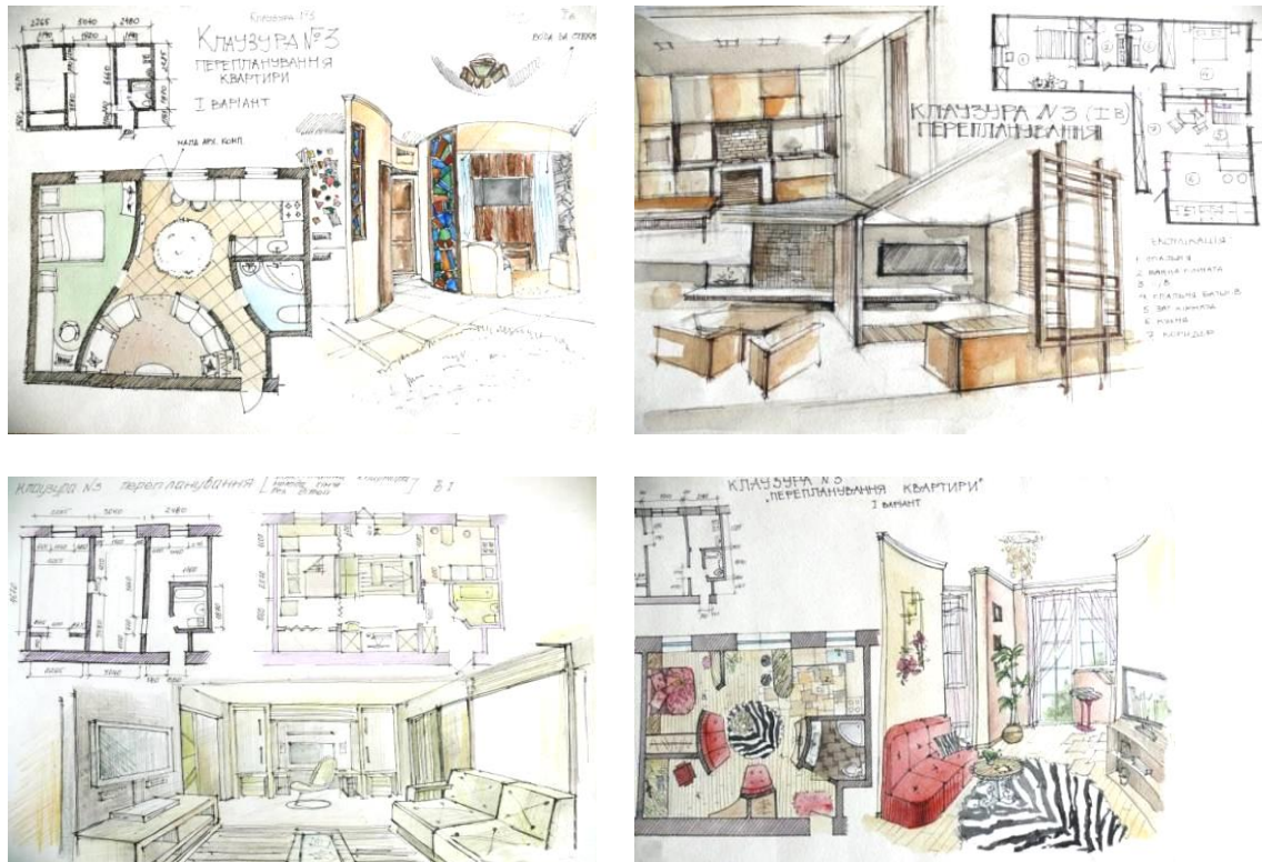
Рис. 3. Приклади клаузур практичної роботи № 3

– дві перспективні зарисовки з різних видових точок, дотримуючись при цьому законів побудови перспективи, а також використати характеристики та ознаки певного стилістичного напрямку (за вибором студента) (рис. 2).