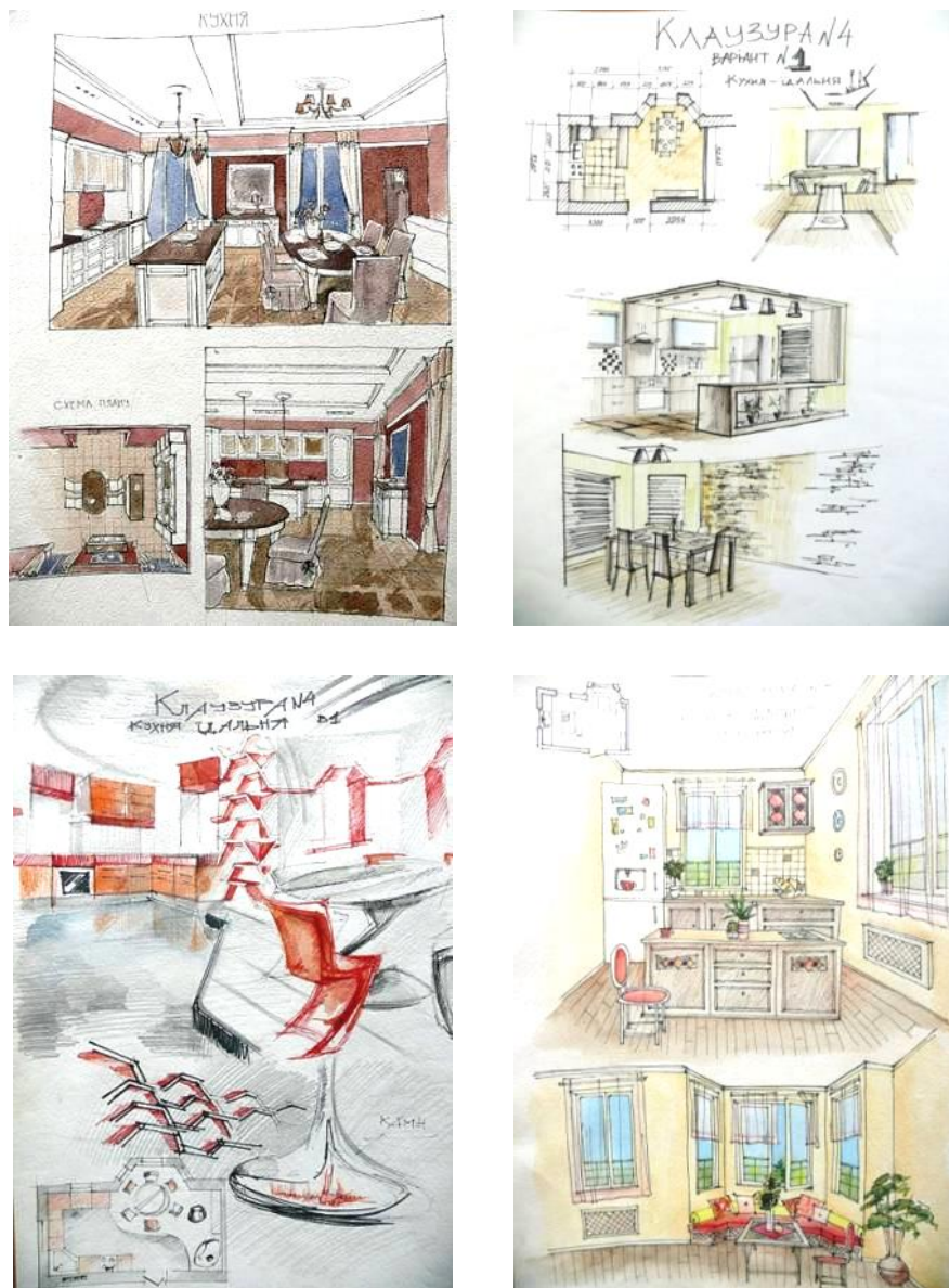
Рис. 2. Приклади клазур практичної роботи № 2

ергономічних вимог. Уся робота виконується з урахуванням ознак певного стилістичного напрямку (за вибором студента).