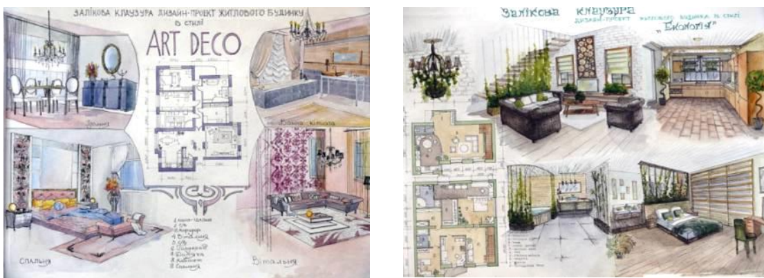
Рис. 6. Приклади клазур практичної роботи № 6

– не менш ніж чотири перспективних зарисовок приміщень різного функціонального призначення (кухня-їдальня, дитяча, спальня кімната, ванна кімната, кабінет, вітальня, сходи і таке інше).