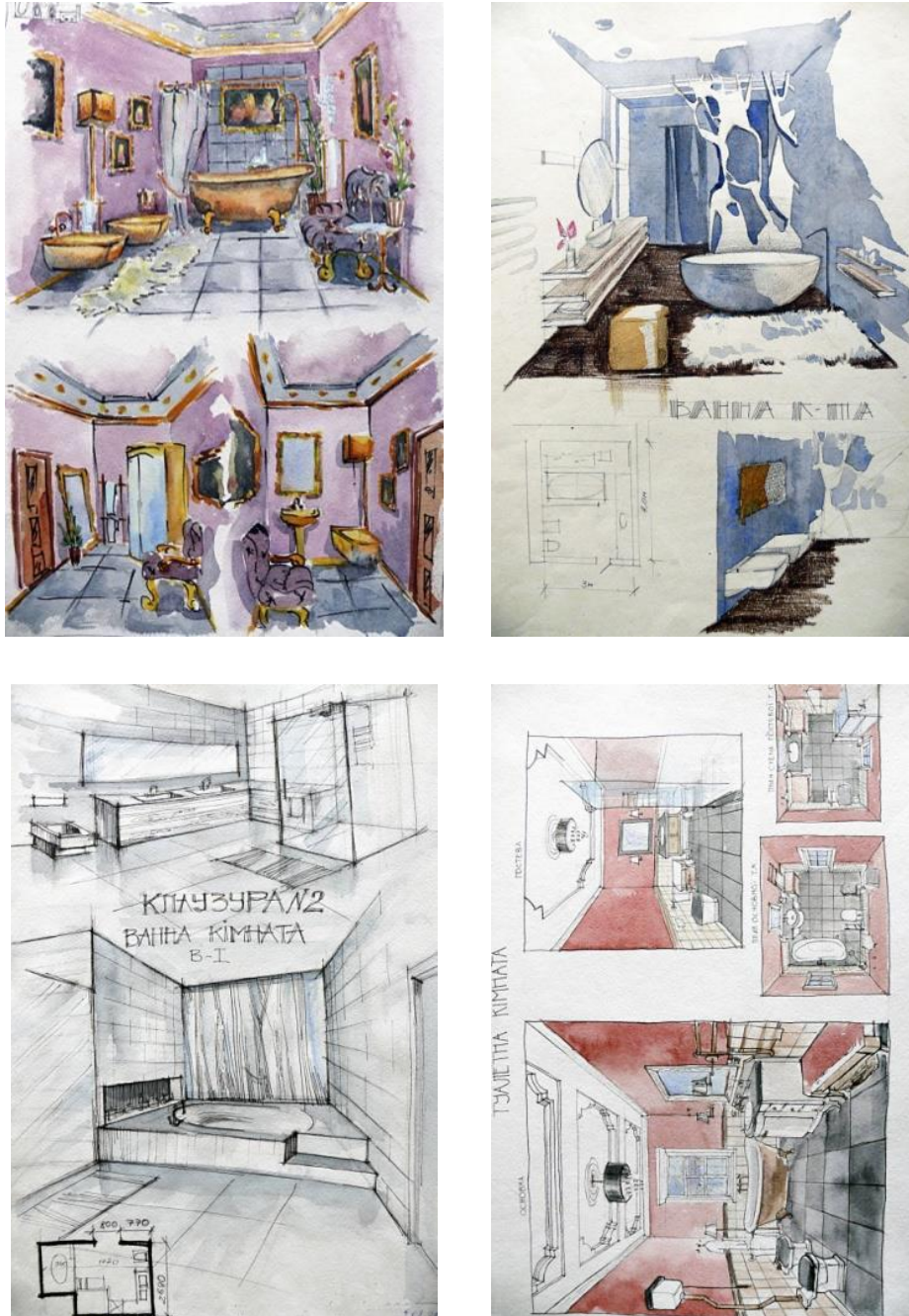
Рис. 1. Приклади клаузур практичної роботи № 1

На третьому курсі студенти виконують роботи на теми: