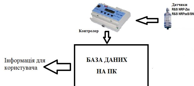
Рис. 3. Схема підключення датчиків до контролера

певний час. ПЗ проведе аналіз і покаже стан системи. Але це за умови, якщо контролер модернізувати, установити на нього додаткові блоки пам'яті, процесор, та додатково його запрограмувати. А це можна віднести до недоліків цього способу підключення.