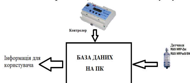
Рис. 2. Схема підключення датчиків до ПК

Іншим варіантом інтеграції датчиків потужності R&S NRP-Z і NRPxS в дану систему є його підключення до контролера, а останнього до ПК з базою даних (рис. 3).