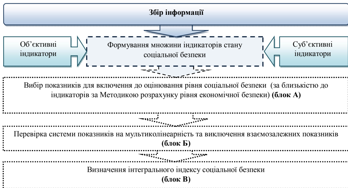
Рис. 1. Загальна схема діагностування стану соціальної безпеки регіону

Блок збору інформації включає 129 показників, які впливають на рівень соціальної безпеки: економічні, аналізу демографічної ситуації, охорони здоров'я Полтавської області, що характеризують зайнятість населення, доходи та витрати населення, споживання продуктів харчування, рівень освіти й виховання, забезпеченість матеріальними благами, антисуспільні прояви, стан довкілля.