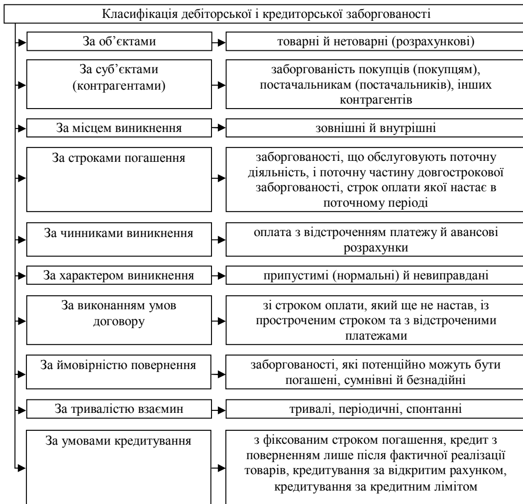
Рис. 2. Класифікація заборгованостей за І.І. Бродською [1]

З метою забезпечення дієвого механізму регулювання розрахунків підприємства з контрагентами цю заборгованість доцільно визначити за такими класифікаційними ознаками (табл. 1).