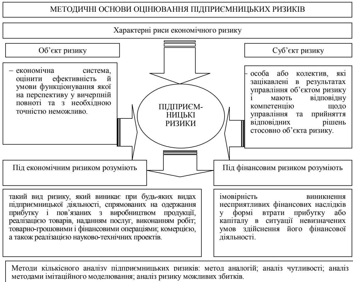
Рис. 1. Методичні основи оцінювання підприємницьких ризиків

Кількісна оцінка підприємницького ризику є доповненням до якісної. За її наявності керуючий суб'єкт спроможний досягти максимуму ефективності в процесі управління фірмою. Наявність ризику в підприємницькій діяльності означає, що для ефективного проведення оцінювання необхідна наявність попередньо розроблених і реальних планів розвитку фірми з урахуванням імовірного характеру проходження подій. Із цією метою здійснюється якісний і кількісний аналіз ризиків.