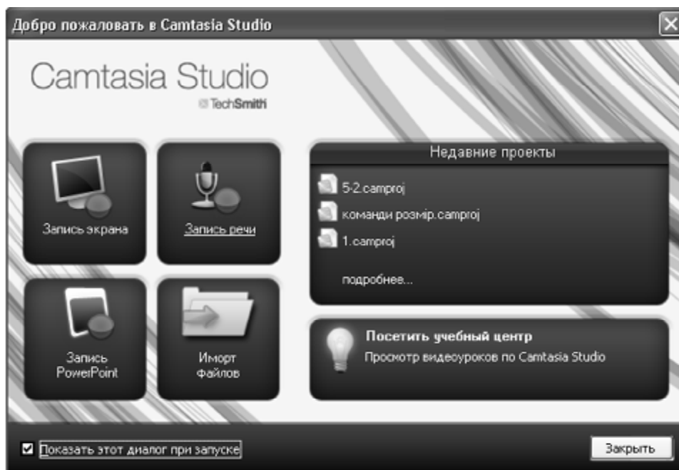
Рис. 1. Головне вікно програми Camtasia Studio

Другий етап процесу створення відеолекції передбачає запис аудіосупроводження. Аудіоряд відеолекції може включати мову, фонову музику, звукові та шумові ефекти. Найбільш поширений формат звукових файлів – WAV. WAV – стандартний формат зберігання звуку в системі Microsoft Windows. Цей формат дозволяє зберігати оцифрований звук, наприклад, з якістю 16 біт і частотою оцифрування до 44,1 кГц. Ця якість відповідає аудіо CD. Для запису однієї хвилини WAV - звуку вищої якості потрібна пам'ять близько 10 Мбайт, тому стандартний об'єм CD (до 640 Мбайт) дозволяє записати не більше від години WAV. Звук можна оцифрувати і з меншою якістю – в цьому випадку файл займатиме менше місця на диску.